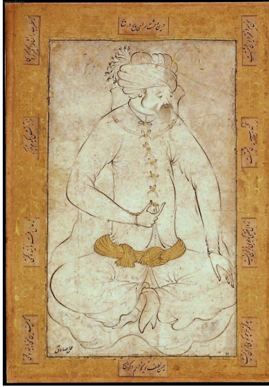
Sadıq Bəy. Oturmuş kişi. təxminən 1595, Boston, TİM

əsərlərinin - qurulmuş texnikalarını və bədii-texniki vasitələrini əks etdirən - metodologiyasını və dünyagörüşünü təqdim, nümayiş etdirir. Sadıqi - Şərq sənətçilərinin - təbiətin müxtəlifliyini öyrənmək, bənzərsiz hadisələrini düzgün əks etdirmək marağını vurğulayır. Onlar - hadisələrin mükəmməlliyinə və tamlığına, obrazların reallığına və təbiliyinə - can atırdılar.