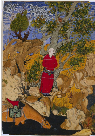
Sadıq Bəy. "Şahnamə" - dən vərəq 1575-1600 Klivlend, İncəsənət Muzeyi.

Bu kitab - müəllifin özünün və sələflərinin təcrübəsinə əsaslanaraq, - rəsm və xəttatlıq üçün ümumi qaydaların, habelə bəzi rəsm materiallarının hazırlanma texnikasının qısa bir toplusudur; müəyyən bir texnoloji prosesin ayrı-ayrı hadisələrinə də diqqət yetirir, rəssamlar tərəfindən- müxtəlif materialların hazırlanması reseptlərini və onlardan necə istifadə olunacağını təsvir edir.