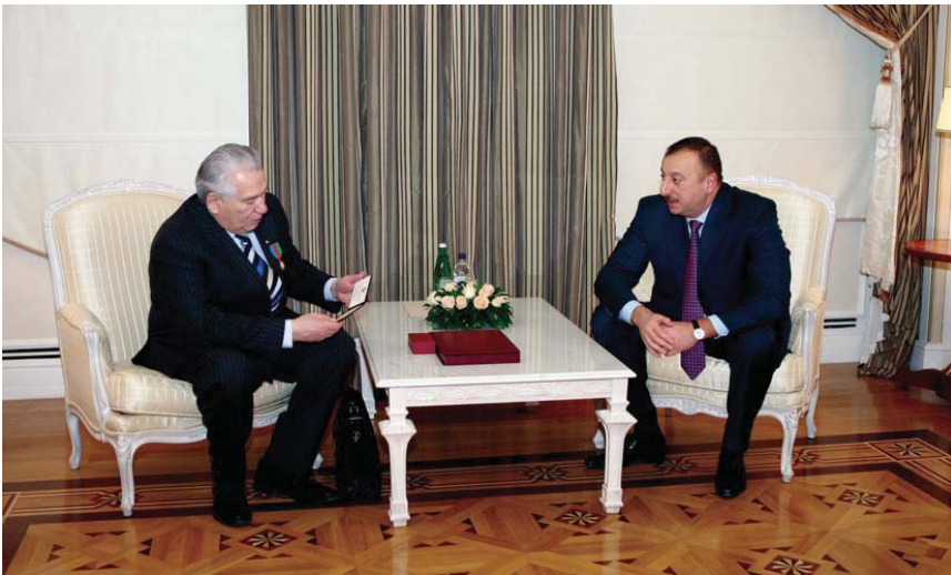
Azərbaycan Prezidenti İlham Əliyev məşhur yazıçı Çingiz Aytmatovu qəbul etmişdir.