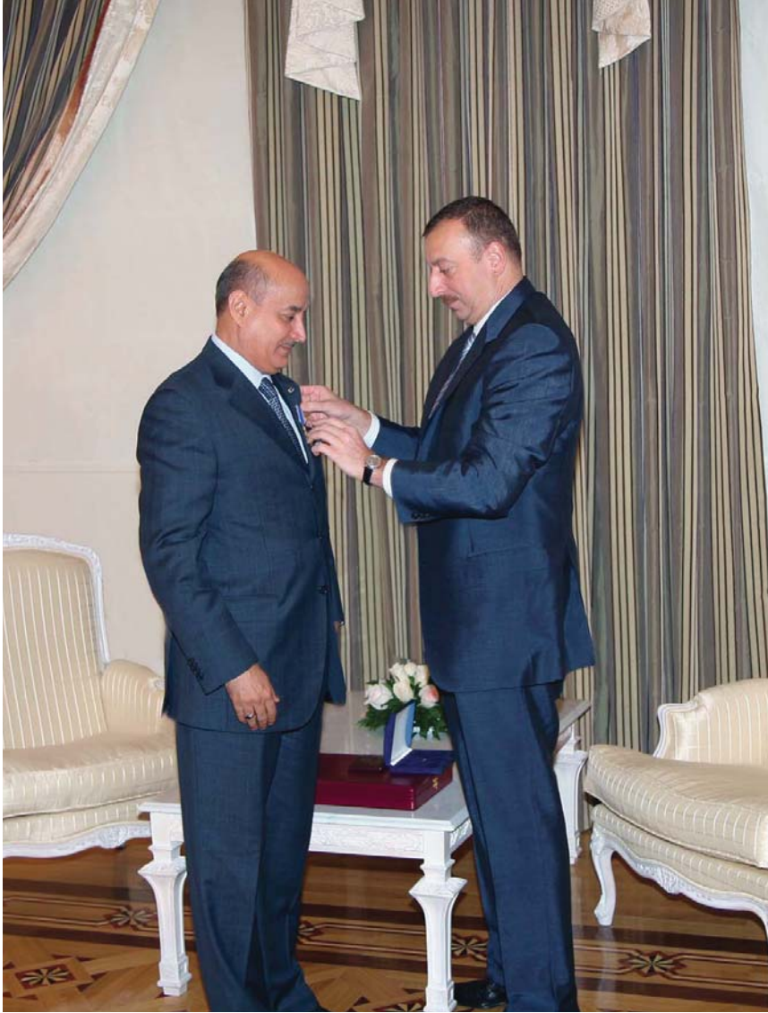
Azərbaycan Prezidenti İlham Əliyev İSESKO-nun Baş direktorunu "Şöhrət" ordeni ilə təltif edir.