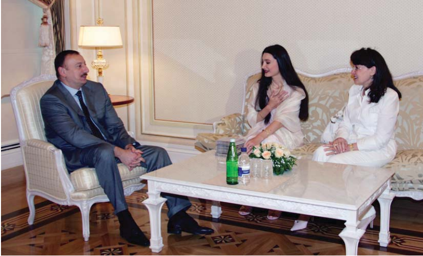
Azərbaycan Prezidenti İlham Əliyev Beynəlxalq Bakı Caz Festivalında iştirak edən məşhur azərbaycanlı pianoçu, bəstəkar və caz ifaçısı Əzizə Mustafazadəni və anası, tanınmış musiqiçi Elza Mustafazadəni qəbul etmişdir.