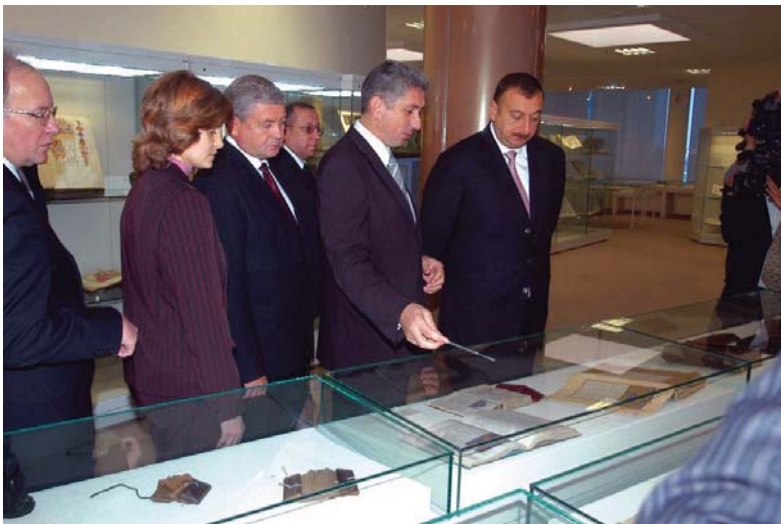
Azərbaycan Prezidenti İlham Əliyevin Belarus Milli Kitabxanasındakı Kitab muzeyində.