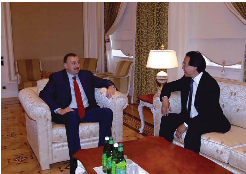
Azərbaycan Prezidenti İlham Əliyev musiqi xadimi, "İpək yolu" layihəsinin rəhbəri, ABŞ violonçelçalanı Yo Yo Mani qəbul etmişdir.