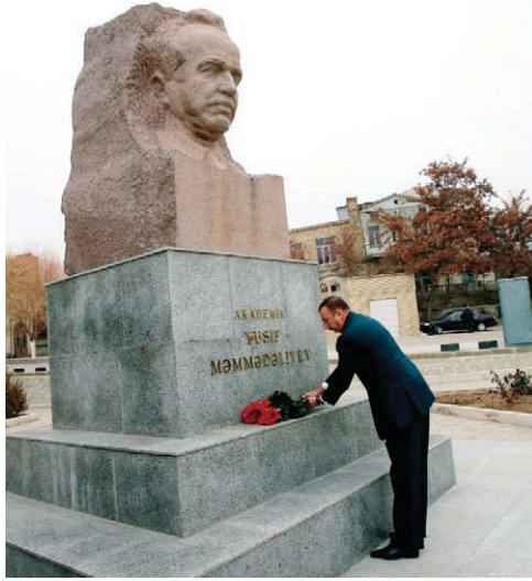
Azərbaycan Prezidenti İlham Əliyev akademik Yusuf Məmmədaliyevin abidəsi qarşısında (Naxçıvan şəhəri)