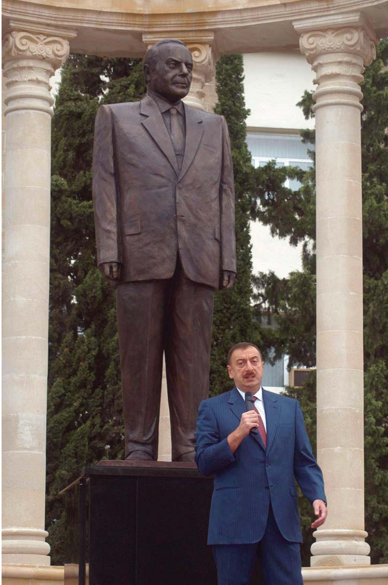
Azərbaycan Prezidenti İlham Əliyev Lənkəran şəhərində ümummilli lider Heydər Əliyevin abidasinin açılış mərasimində.