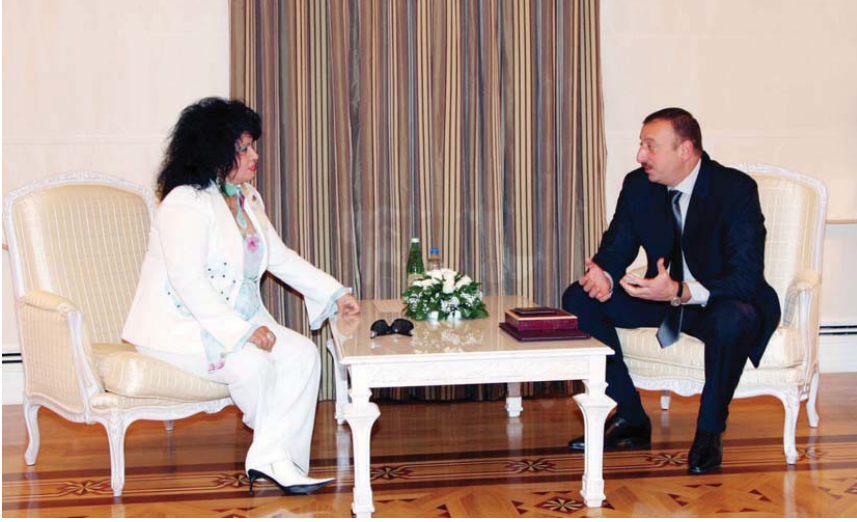
Azərbaycan Prezidenti İlham Əliyev xalq artisti, Milli Məclisin deputatı Zeynəb Xanlarovanı qəbul etmişdir.