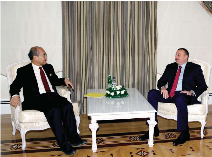
Azərbaycan Prezidenti İlham Əliyev YUNESKO-nun baş direktoru Koïşiro Matsuuranı qəbul etmişdir.