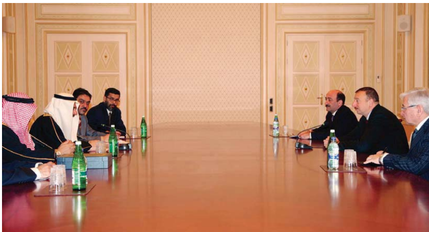
Azərbaycan Prezidenti İlham Əliyev Səudiyyə Ərəbistanının mədəniyyət və informasiya naziri İyad ibn Əmin əl-Mədəninin rəhbərlik etdiyi nümayəndə heyətini qəbul etmişdir.