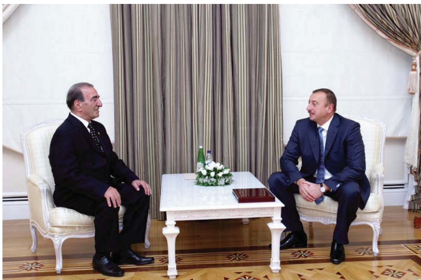
Azərbaycan Prezidenti İlham Əliyev xalq artisti Habil Əliyevi qəbul etmişdir.