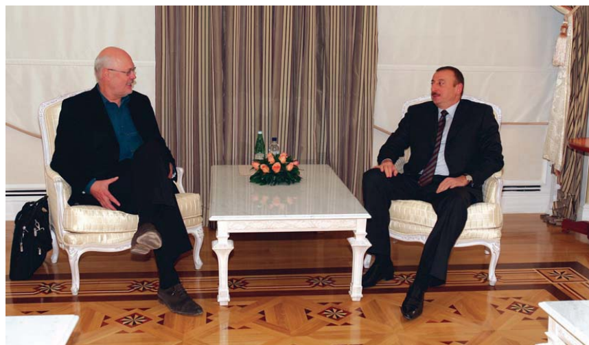
Azərbaycan Prezidenti İlham Əliyev Qugenhaym Fondunun direktoru Tomas Krensi qəbul etmişdir.