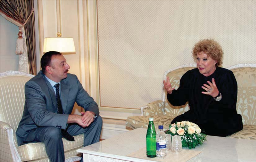
Azərbaycan Prezidenti İlham Əliyev məşhur opera müğənnisi, SSRİ xalq artisti Yelena Obraztsovanı qəbul etmişdir.