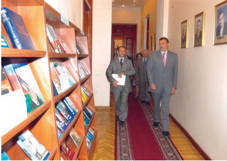
Azərbaycan Prezidenti İlham Əliyev Prezident Kitabxanasında.