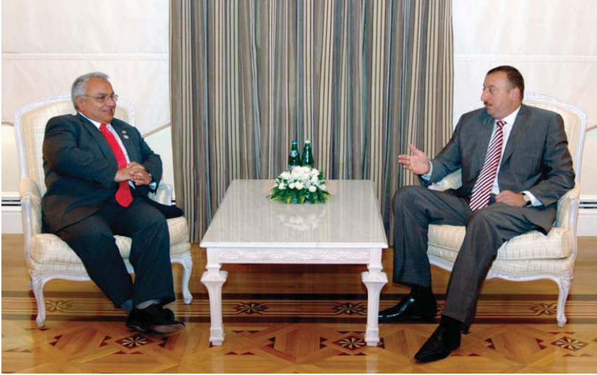
Azərbaycan Prezidenti İlham Əliyev Türkiyənin mədəniyyət və turizm naziri Atilla Koçu qəbul etmişdir.