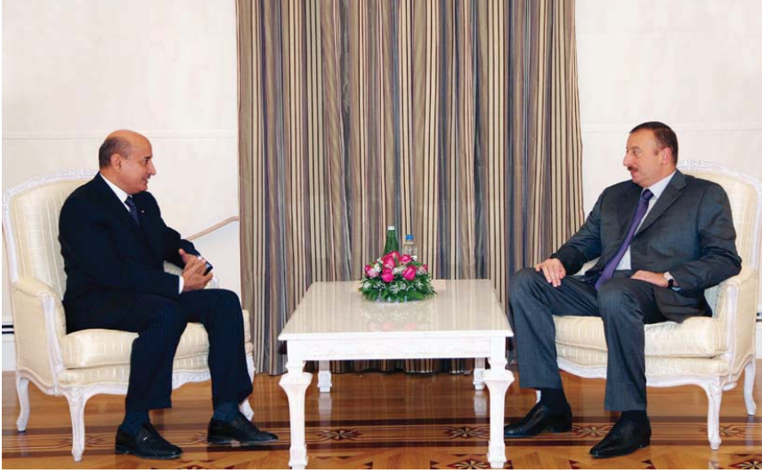
Azərbaycan Prezidenti İlham Əliyev İSESKO-nun baş direktoru Əbdüləziz bin Osman əl-Tuveycrini qəbul etmişdir.