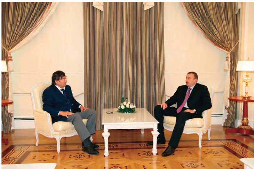
Azərbaycan Prezidenti İlham Əliyev görkəmli qazax şairi, alim və ictimai-siyasi xadimi Oljas Süleymenovu qəbul etmişdir (2007).