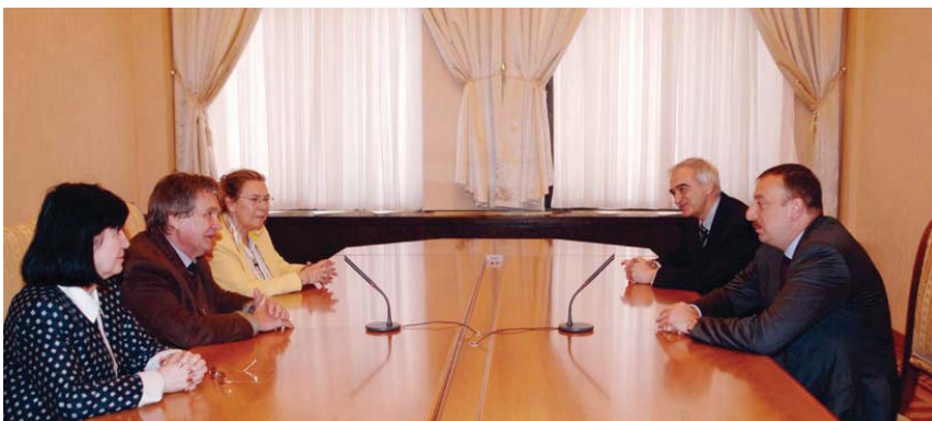
Azərbaycan Prezidenti İlham Əliyev Rusiyanın P.İ.Çaykovski adına Dövlət Akademik Böyük Simfonik Orkestrinin bədii rəhbəri və baş dirijoru Vladimir Fedoseyevi qəbul etmişdir.