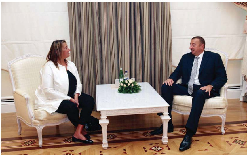
Azərbaycan Prezidenti İlham Əliyev məşhur memar xanım Zaha Hadidini qəbul etmişdir.