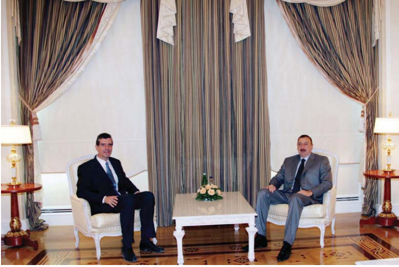
Azərbaycan Prezidenti İlham Əliyev Luvr muzeyinin direktoru Anri Luareti qəbul etmişdir.