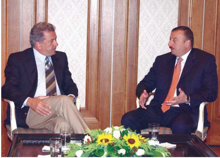
Azərbaycan Prezidenti İlham Əliyev Afinada Yunanistanın turizm naziri Dimitris Avramopulos ilə görüş zamanı.