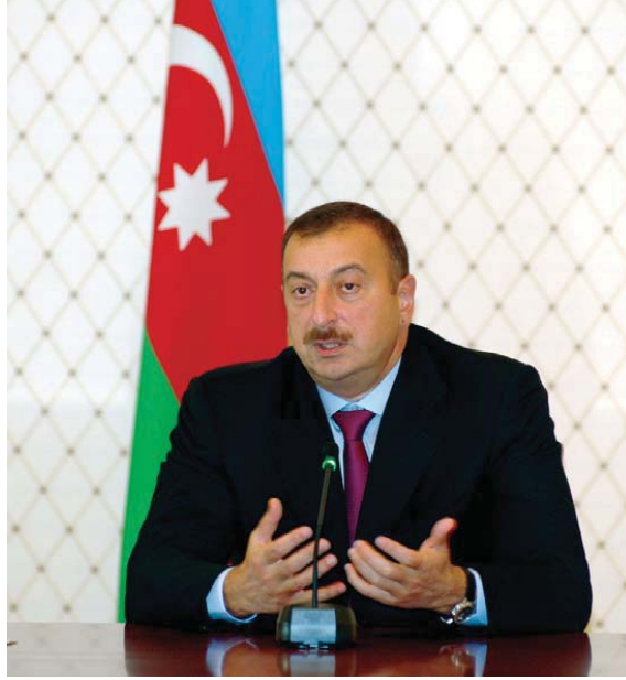
Azərbaycan Prezidenti İlham Əliyev Rusiya Federasiyasının nümayəndə heyətini qəbul etmişdir.