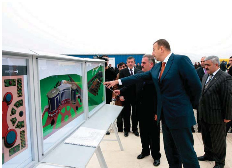
Azərbaycan Prezidenti İlham Əliyevin Naxçıvan Muxtar Respublikasına səfəri: "Duzdağ" sanatoriyasının layihəsi ilə tanışlıq.