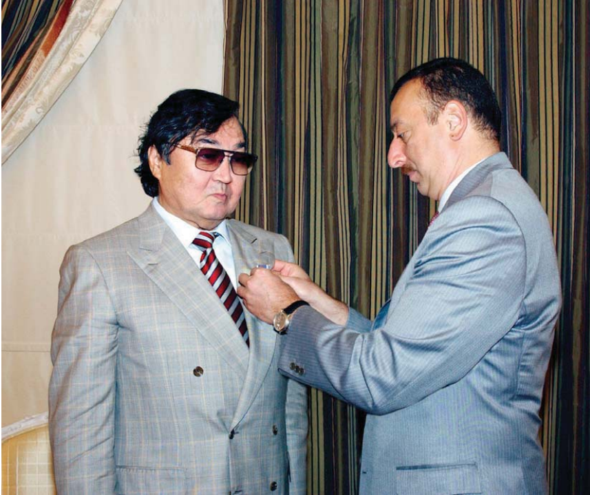
Azərbaycan Prezidenti İlham Əliyev görkəmli qazax sairi, alim və ictimai-siyasi xadim Oljas Süleymenovu qəbul etmişdir (2006-cı il).