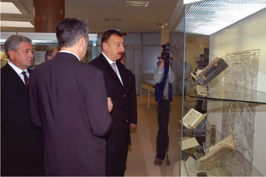
Azərbaycan Prezidenti İlham Əliyevin Belarus Milli Kitabxanasında.