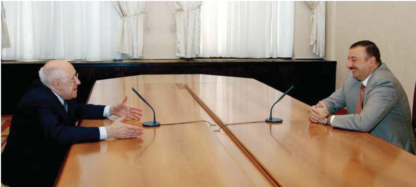
Azərbaycan Prezidenti İlham Əliyev görkəmli musiqiçi və dirijor Mstislav Rostropoviçi qəbul etmişdir.