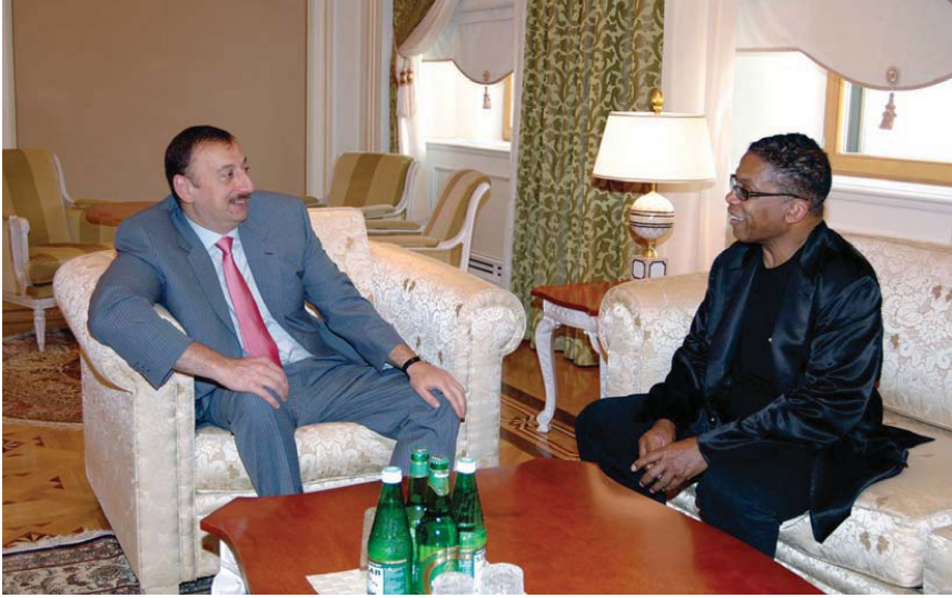
Azərbaycan Prezidenti İlham Əliyev məşhur musiqiçi Herbi Hankooku qəbul etmişdir.