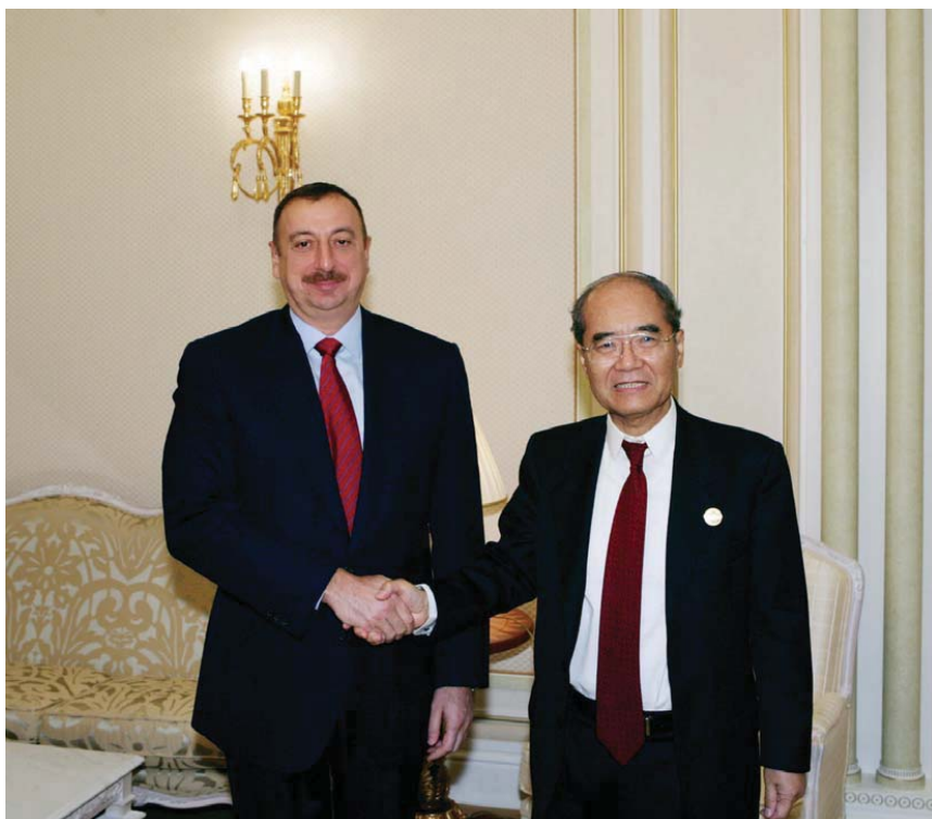
Azərbaycan Prezidenti İlham Əliyev və YUNESKO-nun baş direktoru Koïjiro Matsuura.