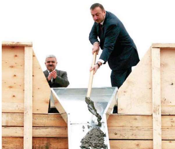
Azərbaycan Prezidenti İlham Əliyevin "Duzdağ" sanatoriyasının təməlqoyma mərasimində iştirakı.