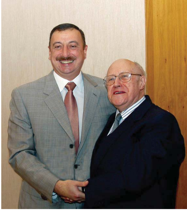
Azərbaycan Prezidenti İlham Əliyev görkəmli musiqiçi və dirijor Mstislav Rostropoviçlə.