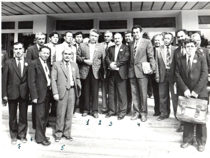
Məşhur yazıçı Çingiz Aytmatov I Ümumiittifaq Türk onomastikası konfransının nümayəndələri ilə. Frunze (Bişkek) şəhəri, 1986.