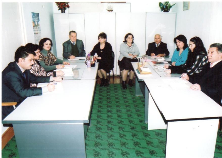
Azərbaycan dili və ədəbiyyatı kafedrasının əməkdaşları. BPKİYİ, 2010.