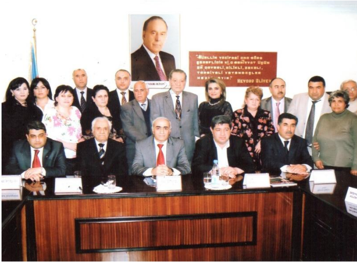
BPKİYİ-də “Heydər Əliyev və Azərbaycan” mövzusunda keçirilən elmi-praktik konfransın bir qrup nümayəndəsi. 7 may, 2010.