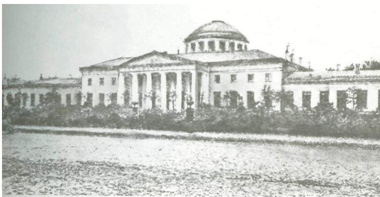
Таврический дворец. Здесь проходили заседания Государственной думы России всех созывов