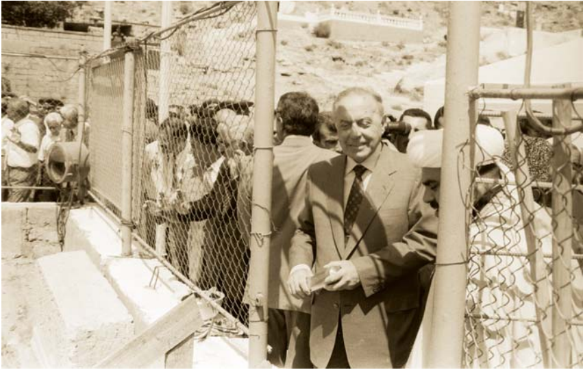
Bibiheybət ziyarətghında məscidin təməlqoyma mərasimi.

Ulu Öndər İmam Museyi-Kazımın qızı, İmam Rızanın bacısı Həzrəti Hökumənin qəbri yerləşən Bibiheybət ziyarətghında bərpa işlərinin aparılmasına və məscid tikintisinə hələ 1994-cü ildə buranı ziyarət edən zaman qərar vermişdi.