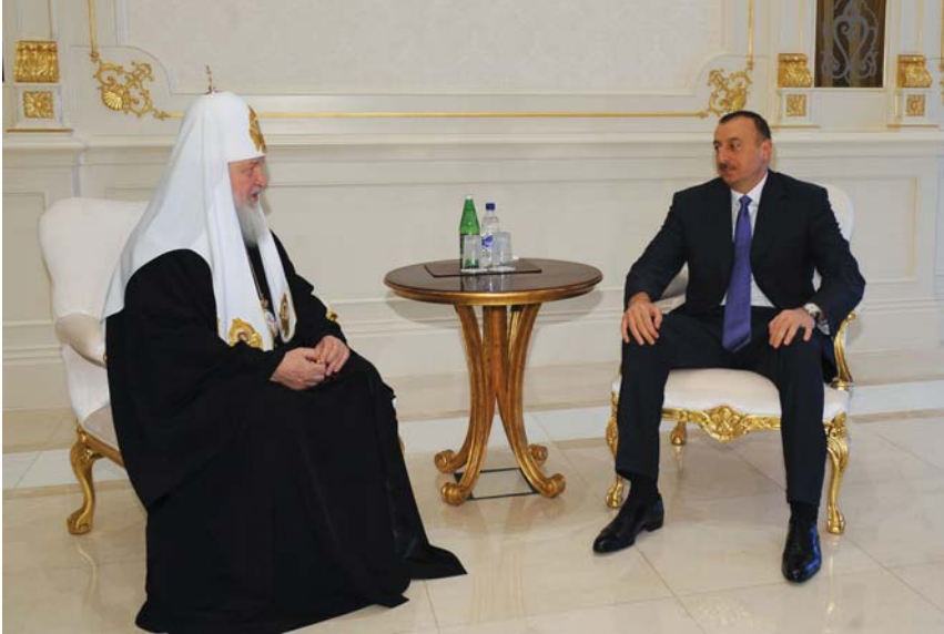
Prezident İlham Əliyev Moskva və Ümumrusiya Patriarxı Kirilli qəbul edərkən.

“Dinlərarası dialoq: qarşılıqlı anlaşmadan birgə əməkdaşlığa doğru” mövzusunda 6-7 noyabr 2009-cu ildə Bakıda keçirilmiş iki günlük beynəlxalq konfrans ölkədə və regionda böyük əks-səda yaradıb.