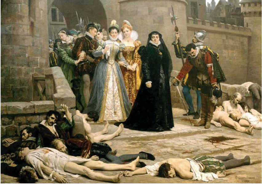
Kraliça Yekaterina Mediçi saray xanımları ilə birgə “Vorfolomey gecəsi”nin qurbanlarına tamaşa edir.

“Varfolomey gecəsi”nin qurbanlarının sayı barədə yekdil fikir yoxdur. Hesab edilir ki, Parisdə təqribən üç min, bütün Fransada isə on min ilə əlli min arasında protestant qətlə yetirilmişdir. Həmin dövrdə qətlə katolik dünyasında rəğbətlə qarşılanmış, Roma Papası XIII Qriqori bu faciəni alqışlayaraq, Vatikanda fişəng atılmasını və medal təsis olunmasını əmr etmişdir. Lakin ədalət naminə qeyd etmək lazımdır ki, 425 il sonra Roma Papası II İohan Pavel rəsmi şəkildə Varfolomey qətliamını qınamışdır.