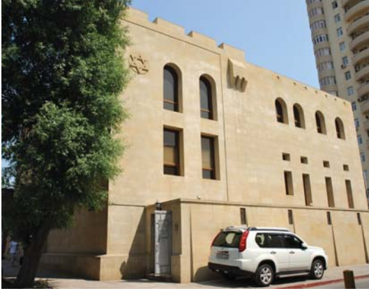
Bakı şəhəri, Avropa (aşkenazi) yəhudiləri sinaqoqu

tədris ocaqlarında “Tövrat”, “Talmud” və “Mişna” kimi müqəddəs kitablar öyrədilib. Yəhudi qızları üçün də xüsusi gimnaziya və məktəblər açılıb.