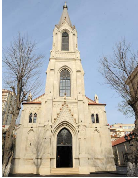
Bakı şəhəri, Lüteron kilsəsi (Kırxa)