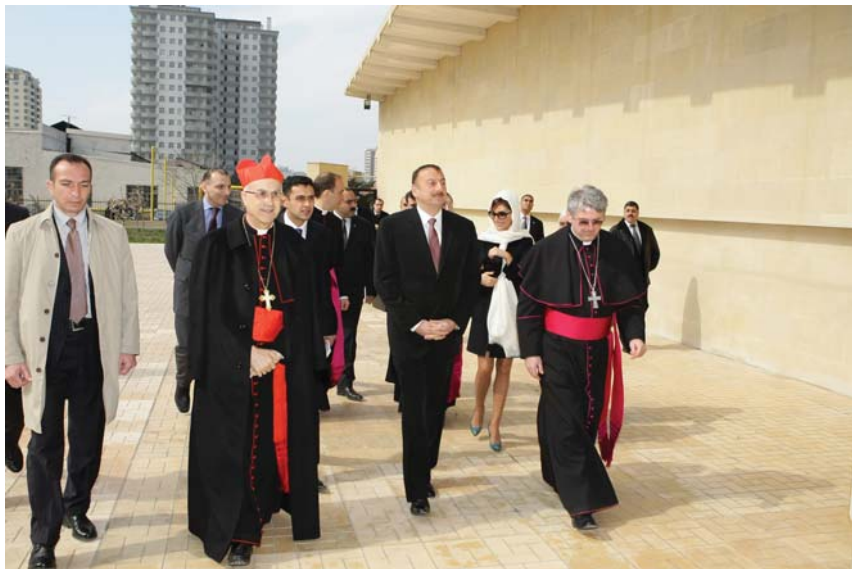
Prezident İlham Əliyev və Vatikanın Dövlət Katibi Tarçizio Bertoni. Bakıda Müqəddəs Məryəm Katolik kilsəsinin açılışı.

Onu da qeyd etmək lazımdır ki, bu gün Prezidenti İlham Əliyev ölkəmizdə fəaliyyət göstərən konfessiyaların dini bayramlarında və əlamətdar günlərində ayri-seçkilik qoymadan müsəlmanlara, xristianlara və yəhudilərə müraciətlər edir, dini və milli bayramlarda insanlar arasında olur, tolerantlıq mühitinin daha da möhkəmləndirilməsi üçün dövlət səviyyəsində həyata keçirilən tədbirlərin icrasına nəzarət edir. Eyni zamanda, dövlət başçısı hər il Ramazan ayında Qafqaz Müsəlmanları İdarəsinin sədri, Şeyxülislam Allahşükür Paşazadənin açdığı iftar süfrəsində iştirak edir. Həmin iftar mərasiminə təkcə İslam dininin nümayəndələri deyil, həm də digər dini konfessiyaların təmsilçiləri qatılırlar. Həmçinin, dövlət tədbirlərinə, o cümlədən ölkə rəhbərliyinin qatıldığı bayram və əlamətdar günlərlə bağlı mərasimlərə dini konfessiyaların başçıları dəvət olunur, onların beynəlxalq konfrans və forumlarda iştirakına hərtərəfli dəstək verilir.