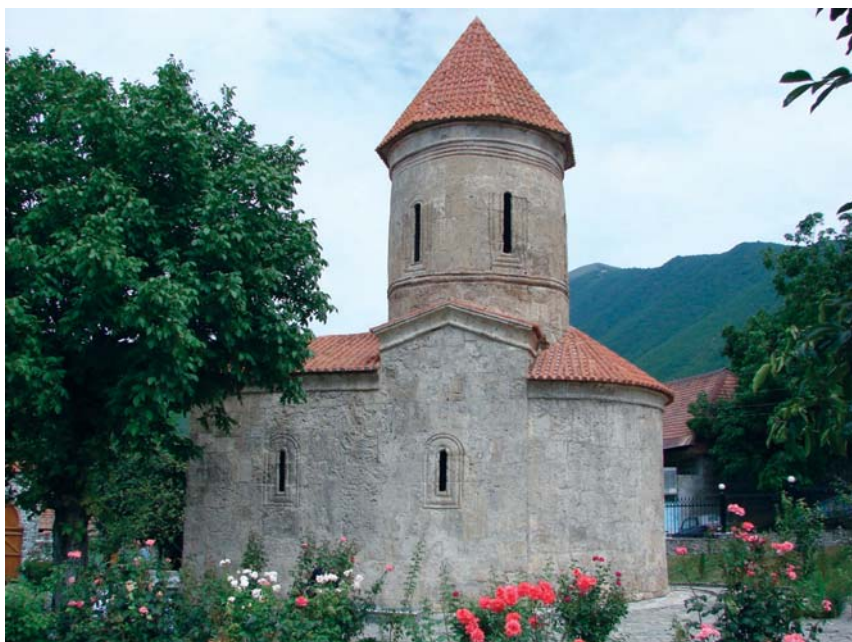
Şəki, Kiş məbədi.

ilə Yelisey məbədidir. Eramızın birinci əsrində Müqəddəs Yelisey tərəfindən inşa olunduğu güman edilən Kiş məbədi yüz illiklər ərzində Alban kilsəsi kimi fəaliyyət göstərmişdir.