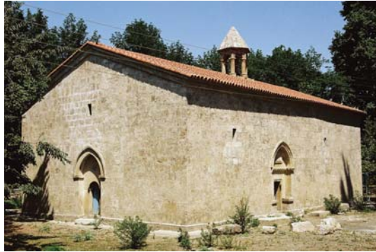
Qəbələ rayonu, Nic qəsəbəsi "Çotari" alban-udi kilsəsi

Qafqaz Albaniyasının ərazisi ilk xristian icmalarının meydana gəldiyi məkanlardan hesab edilir. Xristianlıq hələ dövlət dini statusu qazanmamışdan qabaq – I əsrin əvvəllərində Alban torpaqlarına xristian təbliğçiləri, həvarilər (Ərəblər