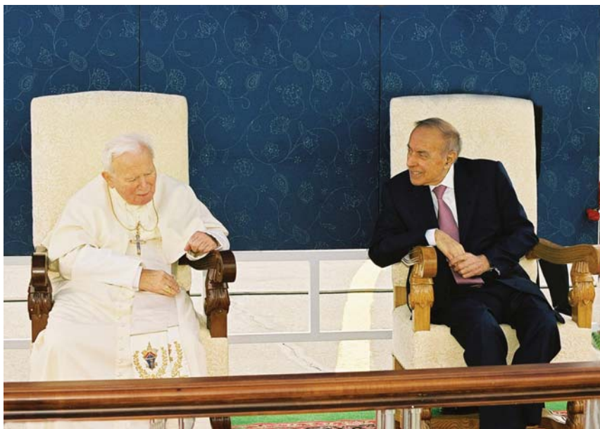
Ulu Öndər Heydər Əliyevin Roma Papası mərhum II İohann Pavellə görüşü.

dinlərinə etiqad etmələri, bərabər işləmələri və bir-birilərinə qarşı durmamaları üçün səy göstərmiş və buna nail olmuşuz” - deyən Moskva və Ümumrusiya Patriarxı II Aleksı əslində bu sözləri ilə həm Heydər Əliyevin xidmətlərini yüksək qiymətləndirdi, həm də Azərbaycanda insan hüquqlarının, o cümlədən vicdan azadlığının qorunduğunu və nəticədə ölkədə nümunəvi spesifik bir tolerantlıq mühiti formalaşdığını təsdiqlədi.