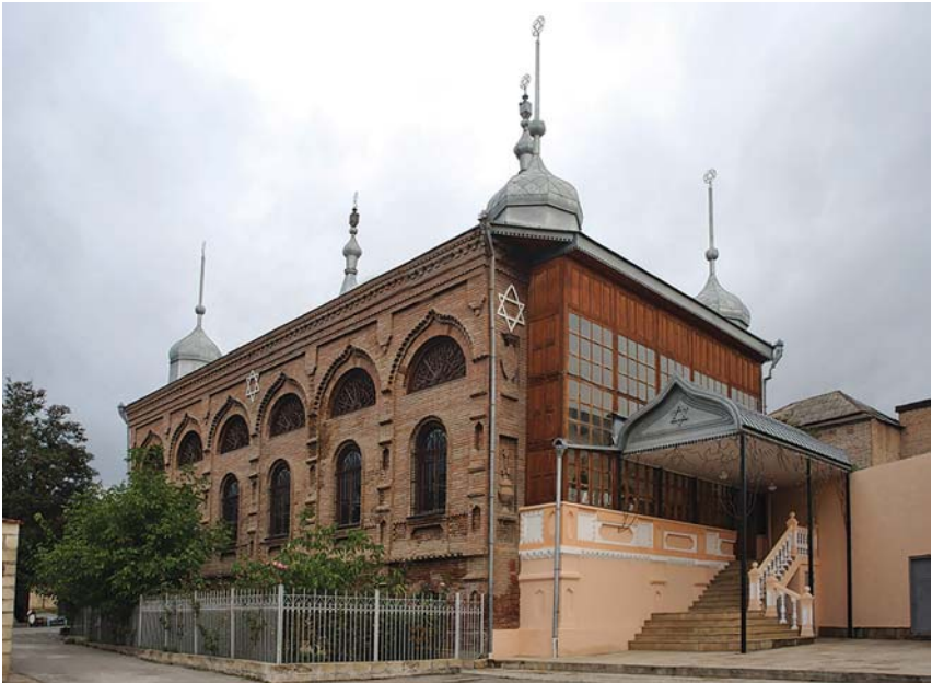
Qırmızı qəsəbə “Altı günbəzli” sinaqoq

Qırmızı qəsəbə – Qafqazın Yerusəlimi: yəhudilərin Azərbaycanda məskunlaşması ilə bağlı fərqli fikirlər var. Amma onların bu əraziyə köçməsinin tarixinin ən azı 2600 il əvvələ gedib çıxmasını hər kəs qəbul edir. Tədqiqatçılar təsdiqləyirlər ki, yəhudilər Azərbaycana indiki İran ərazisindən keçməklə gəlmiş, Dərbəndə qədər getmiş və ölkəmizin əsasən şimal və şimal-qərb hissəsində məskunlaşmışlar. Dərbənd və onun ətrafında, eləcə də Quba, Qusar, Şamaxı, İsmayıllı, Şəki və Oğuzda kompakt şəkildə yaşamışlar.