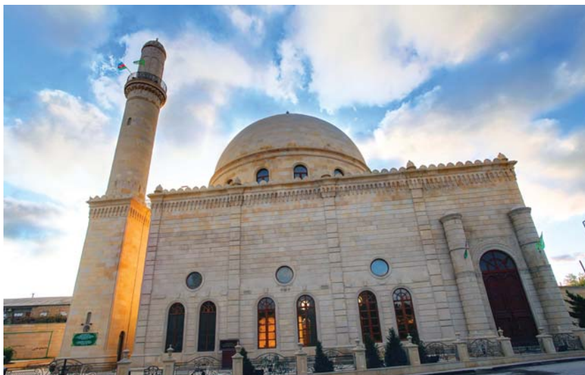
Buzovna Cümə məscidi.

Sahəsi 500 kvadratmetr olan məscid sal daşlardan inşa olunub, fasad ərəb əlifbası ilə yazılan daş kitabələrlə üzlənib. Məscidin hündürlüyü 28 metr, o cümlədən günbəzin hündürlüyü 12 metrdir. İbadət evi ilə yanaşı, burada köməkçi və inzibati binalar, kişilər və qadınlar üçün dəstəməzخانalar, digər otaqlar tikilib.