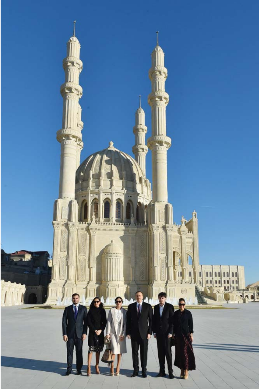
Prezident İlham Əliyev ailə üzvləri ilə birgə Heydər Məscidinin açılışında.