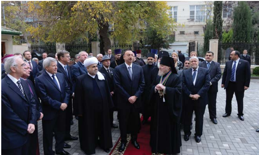
Prezident İlham Əliyev Pravoslav Dini Mədəniyyət Mərkəzinin açılışında

Tolerantlığın təşviq olunması: Azərbaycanda fəaliyyət göstərən dini konfessiyalar arasında tarixən formalaşmış tolerant münasibət mövcuddur. Bu münasibət qarşılıqlı hörmətə, əməkdaşlığa və zərurət yarandıqda bir-birini dəstəkləmək prinsipinə əsaslanır.