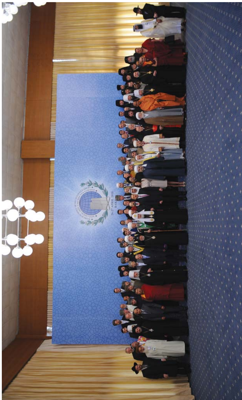
Dini Liderlərin Ümumdünya Sammiti. 26-27 aprel, Bakı.