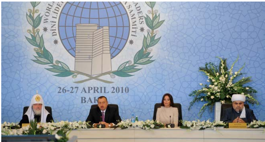
Dini Liderlərin Ümumdünya Sammitinin açılış mərasimi.

2009-cu il noyabrın 11-də Bakıda İslam Konfransı Təşkilatının 40 illiyinə həsr olunmuş “Sivilizasiyalararası dialoq: Azərbaycandan baxış” mövzusunda beynəlxalq konfrans keçirilib. Azərbaycan Diplomatik Akademiyası (ADA) və İKT-nin Baş katibliyi ilə birgə təşkil olunmuş konfransa 41 ölkədən, 3 beynəlxalq təşkilatdan 200-dək elm xadimi, respublikamızda akkreditə olunmuş diplomatik korpusun nümayəndələri və s. qonaqlar qatılıblar. Konfransda əsas mövzular kimi dinlər və sivilizasiyalararası dialoqun qlobal əhəmiyyətindən, İKT-nin bu sahədəki fəaliyyətindən və Azərbaycanın bu prosesə verdiyi töhfələrdən bəhs edilib.