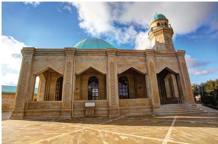
Binə qəsəbəsi, İmam Rza məscidi.