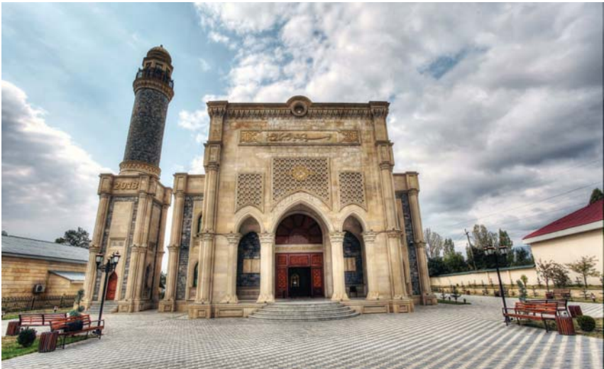
Qabala şəhəri, Yeni Məscid.

Sovetlər zamanı müxtəlif səbəblərdən ciddi zərər dəymiş tarixi-dini abidələrin bərpası, ehtiyac olan yerlərdə yeni ibadət evlərinin inşasına kömək göstərilməsi və şərait yaradılması Azərbaycan hökumətinin din siyasətinin və tolerantlığın təşviqinə yönəlik fəaliyyətinin əsas elementlərindən biridir. Bu, yeni istiqamət deyil, Ulu Öndər Heydər Əliyevin əsasını qoyduğu ənənənin hazırda daha geniş miqyasda uğurla davam etdirilməsidir. Ötən əsrin doxsanıncı illərində iqtisadi problemlərə görə Azərbaycan hökuməti tarixi-dini abidələrin bərpasına kifayət qədər vəsait ayıra bilmirdi, ona görə də proses zəif gedirdi. Ancaq dövlətin iqtisadi imkanları artdığı üçün indi bu sahəyə lazımı qədər vəsait ayrılır. Bunun bariz sübutu Prezident İlham Əliyevin sərəncamları və tapşırığı ilə yenidən qurulmuş və ya bərpa edilmiş tarixi-dini abidələrimizdir. Təkcə bir faktı qeyd edək ki, son on il ərzində ölkədə yüzlərlə məscid inşa olunub, 80-dən artıq məsciddə əsaslı təmir və yenidənqurma işləri aparılıb, o cümlədən dövlət vəsaiti hesabına 10-dan çox məscid tikilib və ya əsaslı bərpa edilib.