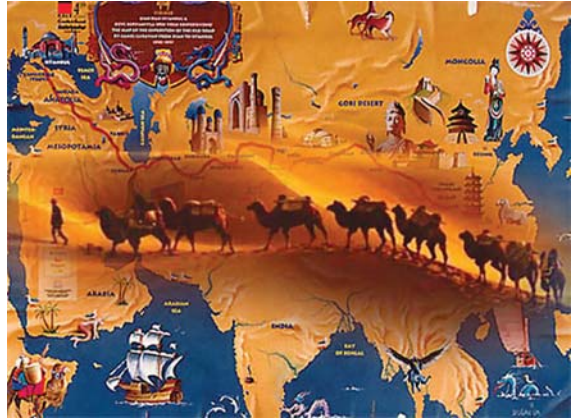
Tarixi İpək yolu.

Tolerantlığa zəmin yaradan iqtisadi amillərdən danışarkən, ilk növbədə Azərbaycanın tarixi İpək yolunun üzərində yerləşməsi xüsusi qeyd olunmalıdır. Uzaq Çindən başlayan və Avropanın qurtaracağında bitən İpək yoluna