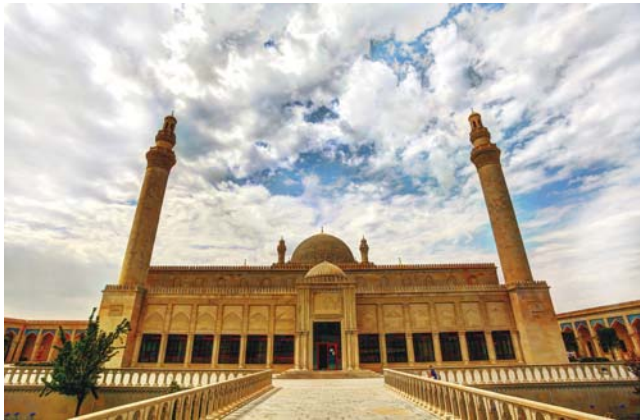
Qafqazın ən qədim məscidlərindən biri: Şamaxı Cümə məscidi

Meydana çıxdığı dövrdən – yeddinci əsrin ortalarından etibarən Azərbaycanda yayılmağa başlayan İslam Azərbaycanın bütün hüceyrələrinə qədər işləyib, silinməz və məhvi