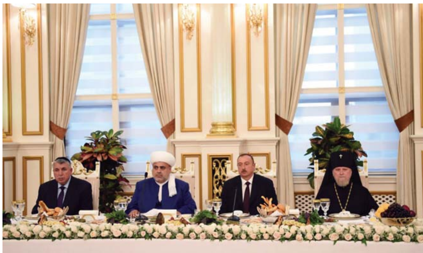
Şeyxülislam Allahşükür Paşazadənin açdığı iftar süfrəsi.

Başqa bir nümunə: müsəlmanların Ramazan ayında təşkil etdikləri iftar süfrələrində digər dinlərin nümayəndələrinin iştirak etməsi praktikası mövcuddur. Eyni zamanda, başqa dinə mənsub dövlət başçılarından, səfirlərin müsəlmanlar, xüsusilə müsəlman din xadimləri və diplomatları üçün protokol xatirinə də olsa, iftar verməsi ənənəsi də var. Amma hansı ölkədə xristian icması müsəlmanlar üçün iftar süfrəsi təşkil edir? Çətin ki, Azərbaycandan başqa belə bir ölkə tapılsın. Maraqlısı odur ki, bu ənənənin əsası tolerantlıq mühitinin daha çox hakim olduğu hansısa şəhərdə - Bakıda, Sumqayıtda, Gəncədə yox, Qəbələ rayonunda qoyulub. Bu rayonun Nic qəsəbəsində kompakt halda yaşayan udi xristianların məhz kilsədə qəsəbənin müsəlman icması üçün iftar süfrəsi təşkil etməsi bütün dünya üçün örnək nümunəyə çevrilib.