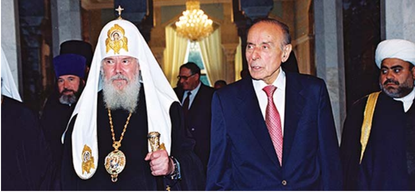
Ulu Öndər Heydər Əliyev və Moskva və Ümumrusiya Patriarxı mərhum II Aleksii

2001-ci ilin may ayında Azərbaycanda səfərdə olan II Aleksii ölkəmizdəki tolerantlıq mühitinə, necə deyərlər, heyran qaldı və səmimi etiraflar etdi: “Burada pravoslavlar heç bir sıxışdırmaya məruz qalmadan öz dinlərinə və əqidələrinə etiqad edirlər. Hətta, bu cür şərait təəssüf ki, bəzi pravoslav ölkələrdə belə yoxdur”.