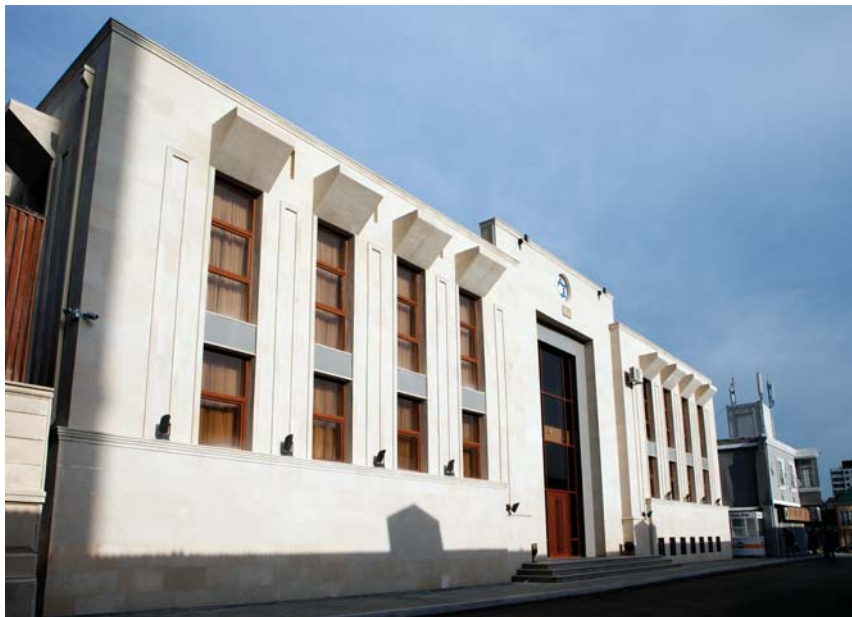
Bakı şəhərində Dağ yəhudiləri üçün inşa edilmiş yeni sinaqoq.

Ulu Öndərin dəstəyi ilə xristian məbədlərinə paralel olaraq yəhudi sinaqoqları da bərpa olunmuş, yeniləri inşa edilmişdir. 2003-cü ilin mart ayında Bakıda yəhudi sinaqoqunun dindarların istifadəsinə verilməsi dünya yəhudilərinin tarixinə əlamətdar hadisə kimi düşmüş, onların diqqətini ölkəmizə yönəltdi. Avropada ən böyük sinaqoq sayılan bu ibadətgah köhnə məbədin yerində inşa olunmuşdur. Sevindirici haldır ki, sinaqoqun tikintisində xaricdə fəaliyyət göstərən yəhudi təşkilatları ilə yanaşı, Qafqaz Müsəlmanları İdarəsi, Rus-Pravoslav kilsəsinin Bakı və Xəzəryanı Yeparxiyası (indiki Bakı və Azərbaycan Yeparxiyası) yaxından iştirak etmişdir. Müsəlmanlarla xristianların yəhudi sinaqoqunun tikintisində iştirakı və yardım göstərməsi dünyada analoqu olmayan hadisədir. Bu, həm Azərbaycan xalqının tolerantlığının, həm Ulu Öndərin din siyasətinin nəticəsinin, həm də gələcəyimiz üçün yaradılan böyük bir zəminin və zəmanətin göstəricisidir.