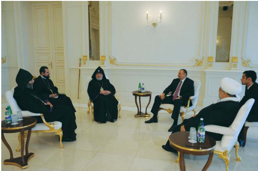
Prezident İlham Əliyev bütün ermənilərin katalikosu II Qaregini qəbul edərkən.

Birinci Forum Bakıda 7-9 aprel 2011-ci ildə keçirilib. Forumda dünyanın lider və ictimai xadimləri, beynəlxalq təşkilatların rəhbərləri, dövlət və hökumət nümayəndələri, parlamentarilər, diplomatlar, qeyri-hökumət təşkilatları, media mənsubları, ümumilikdə 400-dən çox nümayəndə qatılıb. Beynəlxalq Forumun işi kifayət qədər uğurlu olub, nəticədə Prezident İlham Əliyev 27 may 2011-ci ildə Azərbaycanda hər iki ildən bir Ümumdünya Mədəniyyətlərarası Dialoq Forumunun təşkil edilməsi barədə Sərəncam imzalayıb. Sərəncamda deyilir ki, “ölkəmizin İslam dünyası ilə Qərb sivilizasiyası və eləcə də digər mədəniyyətləri təmsil edən xalqlar arasında dialoqun və etimadın möhkəmləndirilməsində mühüm rolunu nəzərə almaqla, müxtəlif mədəniyyətlər arasında əməkdaşlıq üçün qlobal platformanın təmsil edilməsi və Azərbaycan xalqının tolerantlıq mədəniyyətinin, tarixi ənənələrinin beynəlxalq aləmdə tanıtılması məqsədilə qərara alıram: 1. Azərbaycan Respublikasında 2011-ci ildən başlayaraq hər iki ildən bir Ümumdünya Mədəniyyətlərarası Dialoq Forumu təşkil edilsin” .