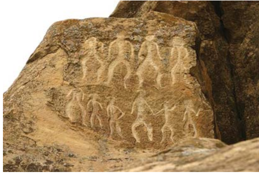
Qobustan qayaüstü rəsmləri

Səmavi dinlərə qədər Azərbaycan ərazilərində müxtəlif inanclara etiqad edilib, daha konkret desək, büt-pərəstlik hökm sürüb. Amma bu dövrdə bəzi inanclara, xüsusilə, oda, suya, ağaca və səma cisimlərinə inam daha