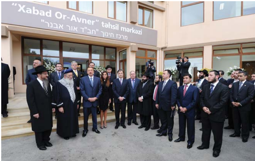
Bakıda Xabad Or-Avner yəhudi Təhsil Mərkəzinin açılış mərasimi.

Hökumətin qarşısına qoyduğu məqsədlərdən biri bu mühiti qoruyub-saxlamaq və inkişaf etdirməkdir. Bunun üçün bütün dini konfessiyalara bərabər münasibət göstərilir, onların əməkdaşlığı üçün münbit zəmin yaradılır. Eyni zamanda, tolerantlığın təşviqi ilə bağlı çoxsaylı tədbirlər və konkret lahiyələr həyata keçirilir. Bu istiqamətdə dövlət qurumları tərəfindən təşkil olunan və ya dəstəklənən tədbirlər, demək olar ki, cəmiyyətin bütün sosial təbəqələrini əhatə edir. Son on ildə bu cür tədbirlər dini icmalarla yanaşı, dini və dünyəvi təhsil verən tədris müəssisələrində, idarə və təşkilatlarda, yerli icra hakimiyyəti və hüquq mühafizə orqanlarında, hətta, cəzaçəkmə müəssisələrində təşkil olunub. Tolerantlığın təşviqi ilə bağlı tədbirlər həm dövlət qurumları, xüsusilə Dini Qurumlarla İş üzrə Dövlət Komitəsi tərəfindən, həm də hökumətin dəstəyi ilə dini qurumlar və qeyri-hökumət təşkilatlarının xətti ilə keçirilir.