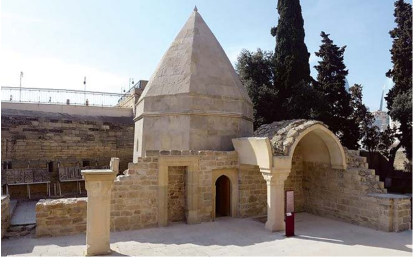
İrfan mədəniyyətinin görkəmli nümayəndəsi Seyid Yəhya Bakuvinin türbəsi (İçərişəhər)

Dini-mədəni amil: din insanların ümumilikdə cəmiyyətin digər dinlərə və xalqlara münasibətini müəyyənləşdirən başlıca amillərdən biridir. Çünki insanların dünyagörüşü, əxlaqı, həyat tərzini daha çox din əsasında formalaşır. Təbii ki, ən uzağı bir əsr öncəni götürsək, din cəmiyyətin həyatında indikindən qat-qat artıq rol oynayıb. O dövr üçün nəinki dinsiz cəmiyyəti, hətta, dindən uzaq insanı belə təsəvvür etmək çox çətindir. Yəqin, elə buna