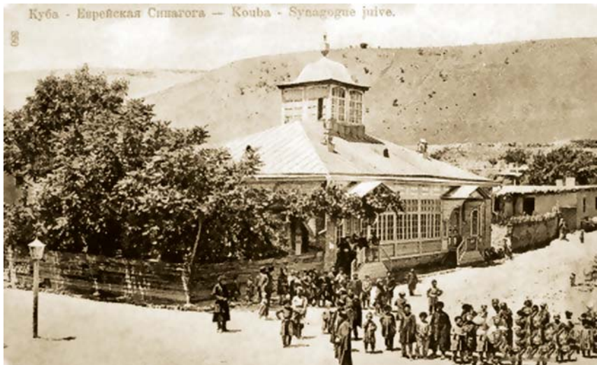
Quba rayonu, Qırmızı qəsəbədə tarixi sinaqoq.

Lakin Dağ yəhudiləri ilə türk Xəzər xaqanlığının əsas əhalisi olan xəzərlər arasında etnik bağların olub-olmaması məsələsi tədqiqatçılar arasında mübahisə və müzakirə predmeti olaraq qalır. VI əsrdə qurulan və X əsrin ikinci yarısında (965-ci il) dağılan bu xaqanlıq Şərqi Göytürk dövləti dağılıdıqdan sonra yaranmış, Qara dənizin Şimal sahillərində, Kiye və qədərki bugünkü Ukrayna torpaqlarında, Xəzər dənizinin Şimal və Şimal-Qərbinə əhatə edən geniş ərazilərdə hökm sürmüş türk dövləti idi. Paytaxtı əvvəl Səməndər, sonra İdil şəhərləri olub.