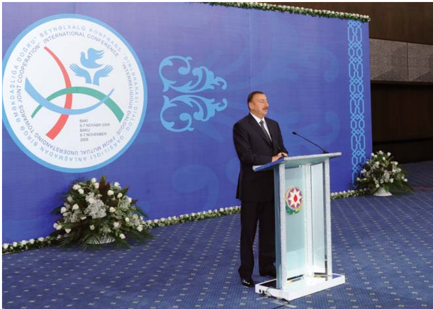
Prezident İlham Əliyev “Dinlərarası dialoq: qarşılıqlı anlaşmadan birgə əməkdaşlığa doğru” mövzusunda beynəlxalq konfransda çıxış edərkən.

iti dini qurumlarla yanaşı, həm də ayrı-ayrı təşkilatlara verilir. Məsələn, Prezident İlham Əliyev Azərbaycanda dini mədəniyyətin, tolerantlığın, dinlərarası və mədəniyyətlərarası dialoqun təbliğinin gücləndirilməsini təmin etmək məqsədilə Azərbaycan Respublikasının dövlət büdcəsində nəzərdə tutulmuş Prezidentin ehtiyat fondundan “Dini Mədəniyyətin İnkişafı” Fonduna 3 milyon manat ayrılması barədə 2014 və 2015-ci illərdə sərəncamlar imzalayıb.