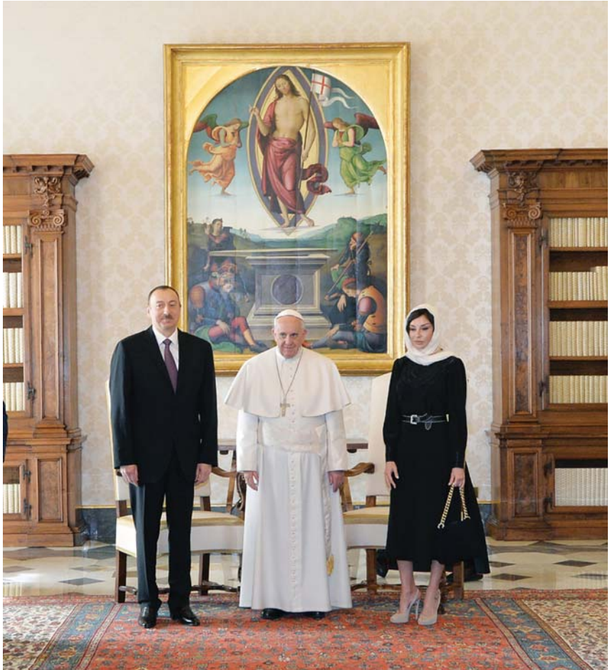
Prezident İlham Əliyev, xanımı Mehriban Əliyeva və Roma Papası Fransiski.

Bunlardan əlavə, Azərbaycan tolerantlıq və multikulturalizm sahəsində təcrübəsini yaymaq və təbliğ etmək, eləcə də bu dəyərləri