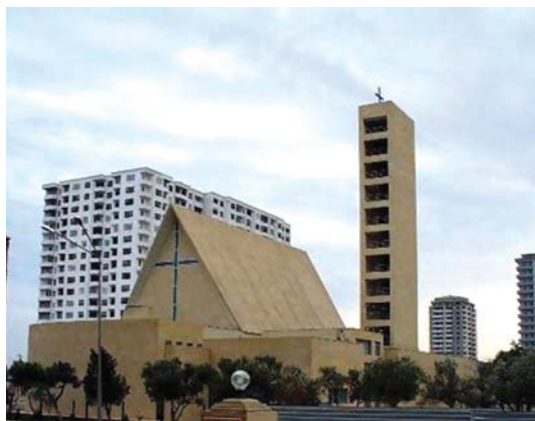
Bakı şəhəri, Müqəddəs Məryəm Katolik kilsəsi.

Katoliklik: Hazırda saylarının az olmasına baxmayaraq, Azərbaycanda katolikliyin tarixi pravoslavlıqla müqayisədə daha qədimdir. Təxmini hesablamalara görə, katolikliyin ölkəmizdə tarixi yeddi əsrdən az deyildir. Amma bununla belə, Katoliklik Azərbaycanda mövcud olan