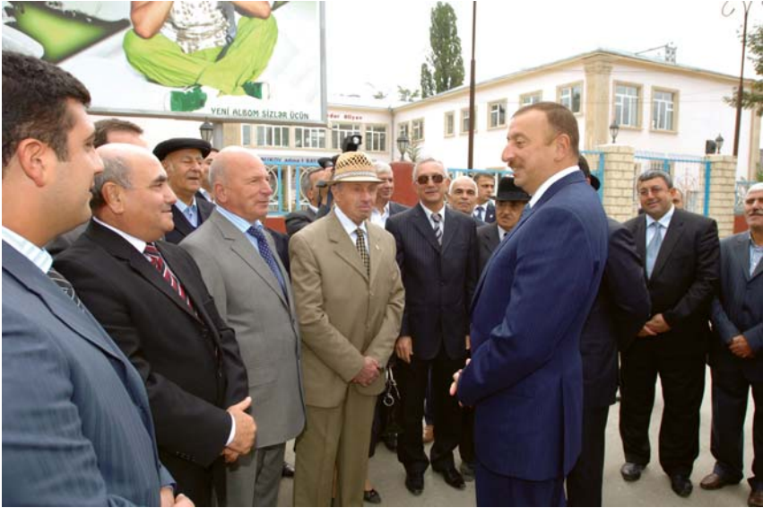
Azərbaycan Prezidenti İlham Əliyev Qırmızı qəsəbədə.

bərpa etdikdən sonra isə İsrailə və Rusiya Federasiyasının müxtəlif şəhərlərinə köçüb. Nə qədər qərribə də olsa, həqiqətdir ki, müxtəlif vaxtlarda Qırmızı qəsəbədən köçmüş yəhudilər vətənlərini nəinki unutmur, hətta, başqa ölkələrdə yaşamalarına baxmayaraq, burada özlərinə ev tikirlər.