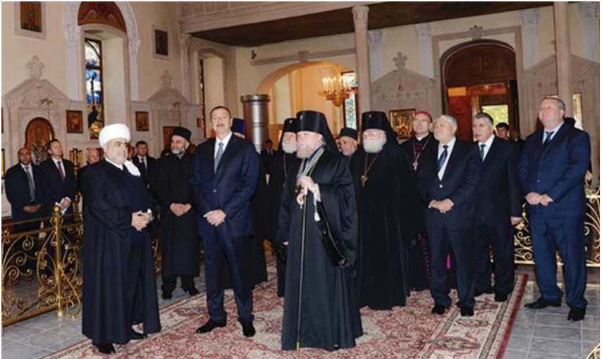
Prezident İlham Əliyev dini konfessiyaların rəhbərləri ilə.

Bu baxımdan Azərbaycandakı toleranlığın və dinlərarası dialoqun səbəbini həm də bunda axtarmaq lazımdır. Azərbaycanda dini konfessiyalar arasında tarixən formalaşmış qarşılıqlı hörmət hissi zaman keçdikcə bir-birinə dəstək münasibətləri ilə əvəz olunub. Bəlkə də, bir çoxlarına, hətta, beynəlxalq ekspertlərə də qərribə gələ bilər. Onlar fikirləşərlər ki, fərqli dinlərin mənsubları bir-birini necə dəstəkləyə bilər? Axı onlar ən yaxşı halda rəqibdir?! Lakin qərribə olsa da, bu həqiqətdir. Azərbaycandakı dini konfessiyalar dar gündə bir-birilərinə qarşı çıxmamış, birləşməyi, həmrəy olması bacarmış, hətta, xoş günlərdə belə, bir-birini dəstəkləmişlər.