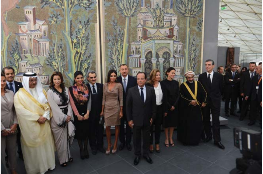
Parisin Luvr muzeyində İslam incəsənətinə həsr olunmuş yeni zalların açılış mərasimi.

çərçivəsində Heydər Əliyev Fondu və “Or-Avner” Beynəlxalq Fondu tərəfindən inşa edilib. 2007-ci il mayın 31-də Heydər Əliyev Fondunun prezidenti Mehriban Əliyevanın iştirakı ilə mərkəzin təməlqoyma mərasimi keçirilib. Təhsil Mərkəzinin tikintisi 2010-cu ildə başa çatıb. 2010-cu il oktyabrın 4-də Azərbaycan Prezidenti İlham Əliyev, xanımı Mehriban Əliyeva və MDB Yəhudi İcmaları Federasiyasının və “Or-Avner” Beynəlxalq Fondunun prezidenti Lev Levayev Təhsil Mərkəzinin açılışında iştirak ediblər.