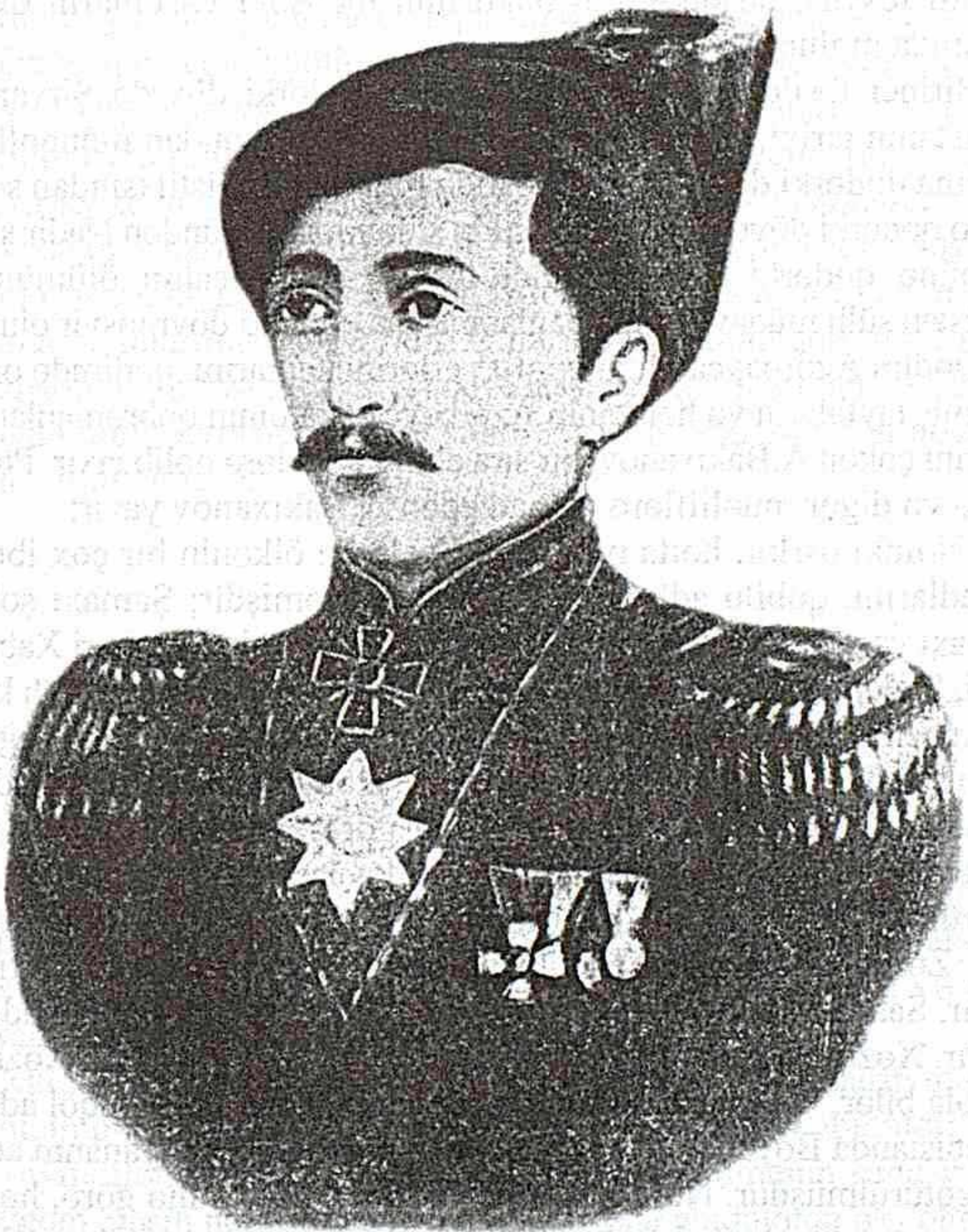
Abbasqulu ağa Bakıxanov