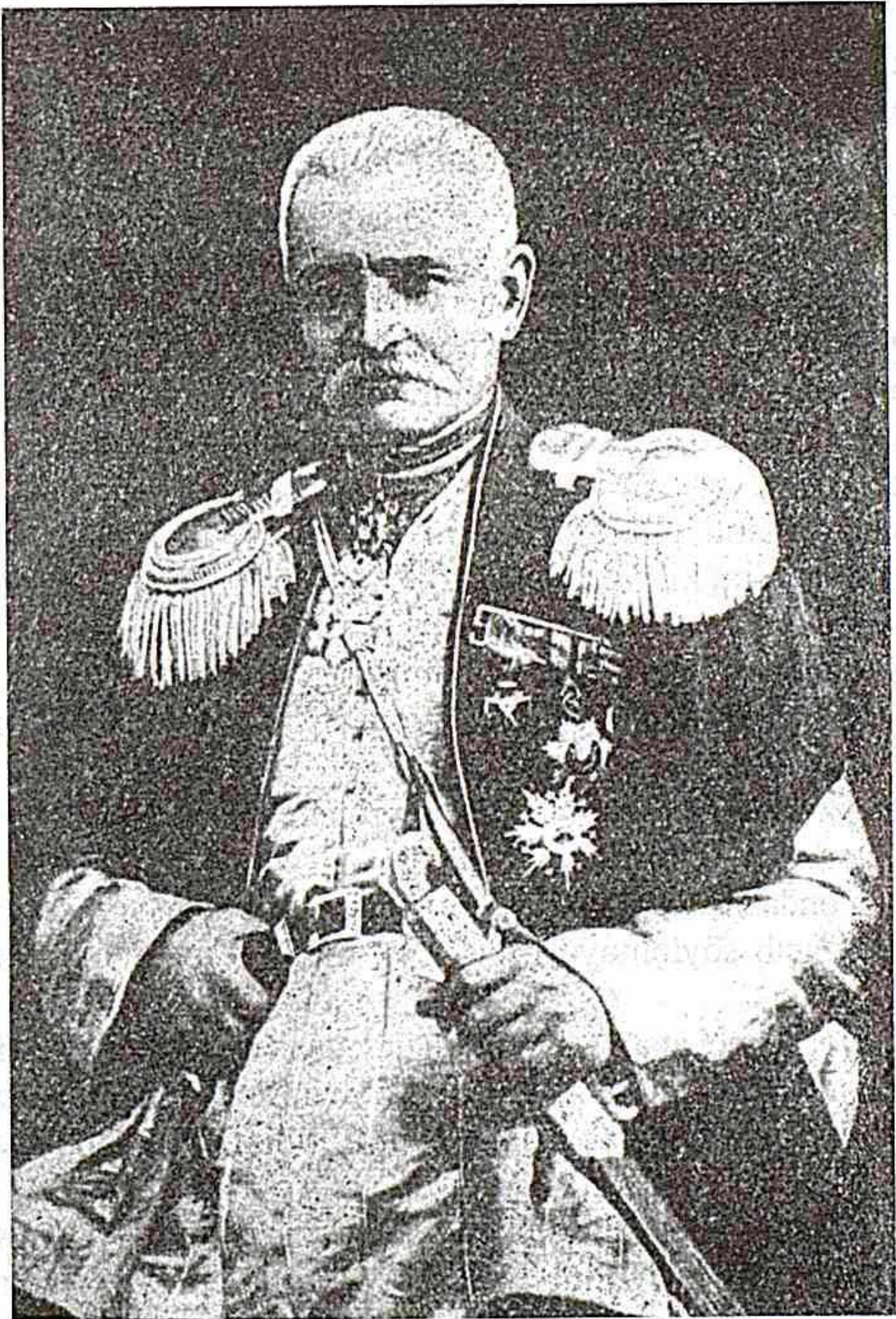
Mirzə Fətəli Axundov