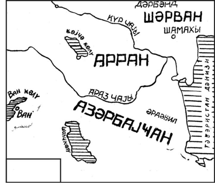
Azərbaycanda Babəkə tabe olan yerlər.

Hicri IV əsrə qədər Bərdə ətrafında Arran ya Alan dilində danışardılar. Bu ərazidə həm də xristian dini davam edirdi. Eləcə də Quba şəhərinin təqribən 25 kilometr cənub-şərqində indi də qalıqları duran Şabran və bu gün Nuxa adlanan Şəki şəhərləri əhalisinin çoxu xristian idilər.