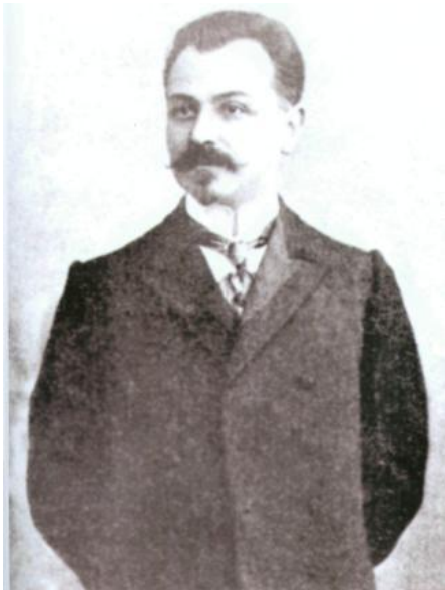
Azərbaycan Xalq Cümhuriyyəti nazirlər şurasının ilk sədri Fətəli xan Xoyski