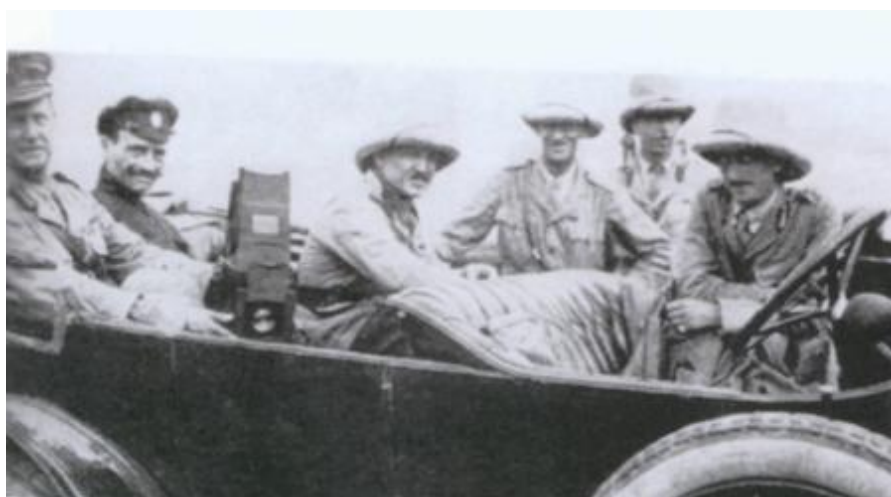
General L. Densterville Bakı ətrafında cəbhə xəttində. Sentyabr, 1918-ci il.