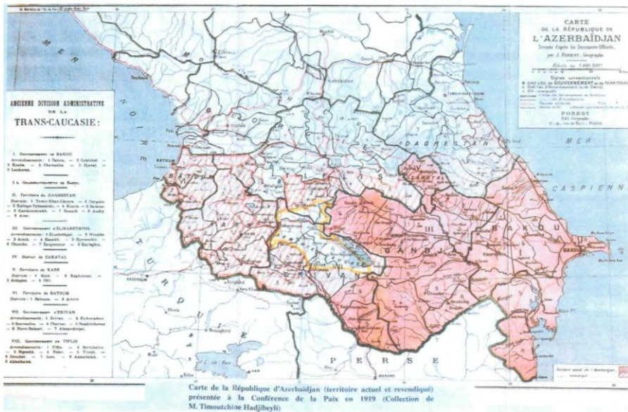
Azərbaycan nümayəndə heyətinin Paris sülh konfransına təqdim etdiyi xəritə. İyun, 1919-cu il.