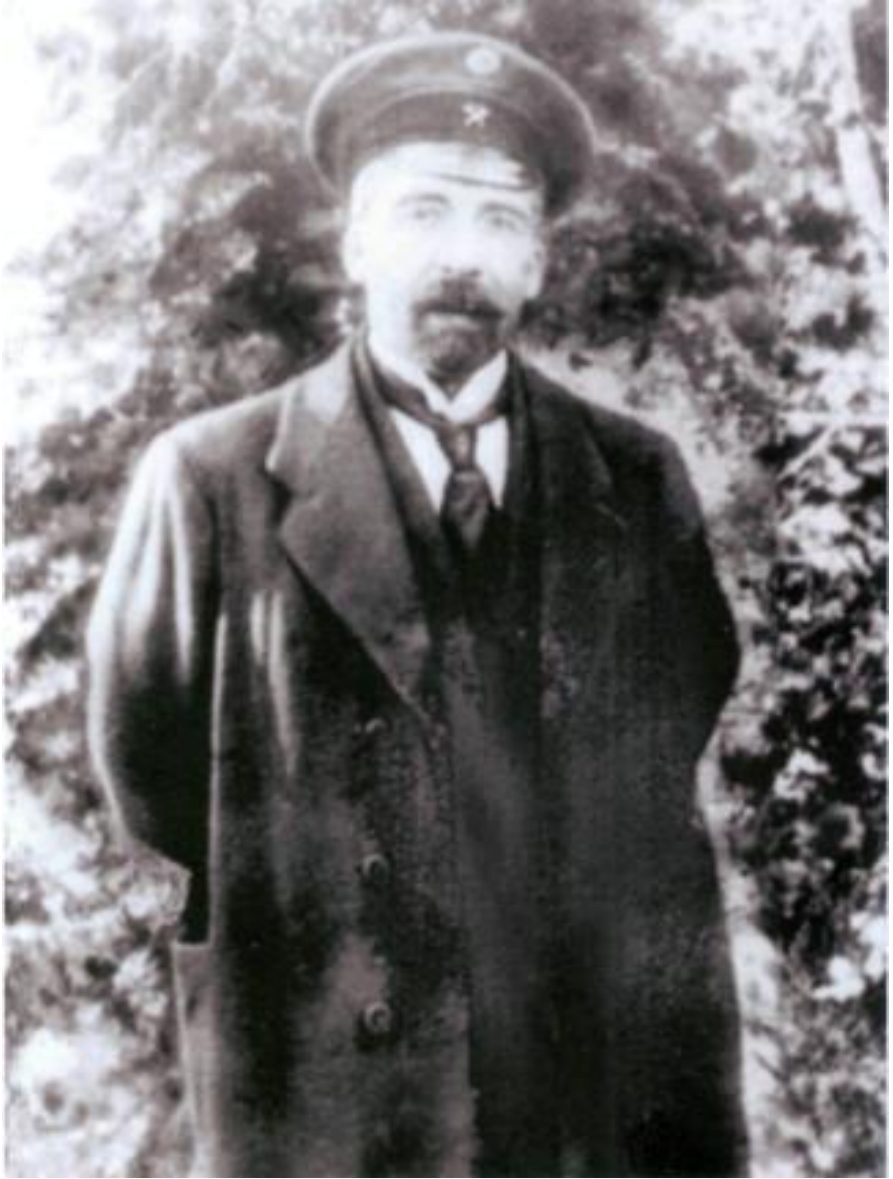
Azərbaycan Xalq Cümhuriyyətinin ilk xarici işlər naziri Məmməd Həsən Hacınski