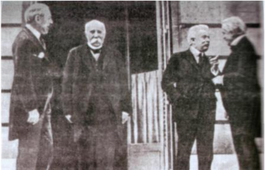
D.Lloyd Corc, V.Orlando, J.Klemanso və V.Vilson Paris Sülh konfransında. 1919-cu il.