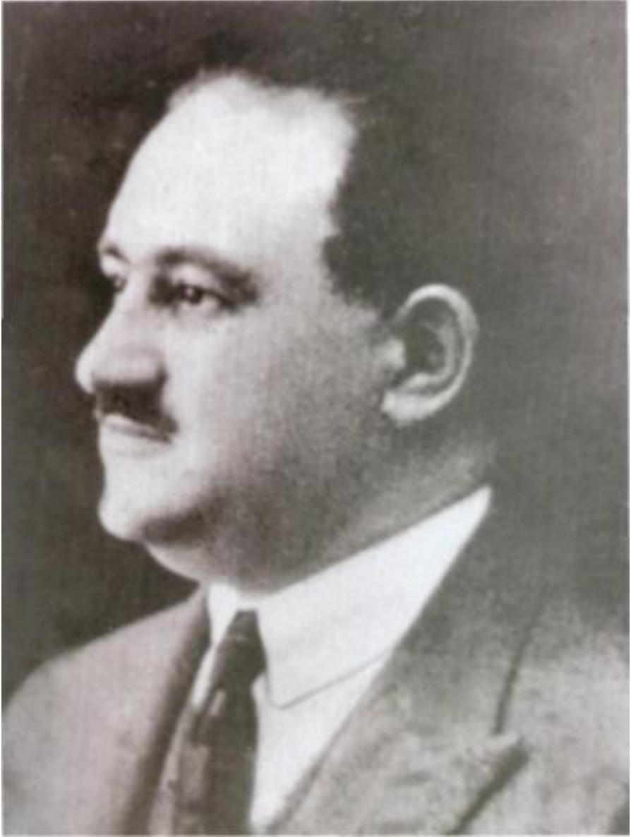
Azərbaycan Milli Şurasının sədri Məmməd Əmin Rəsulzadə