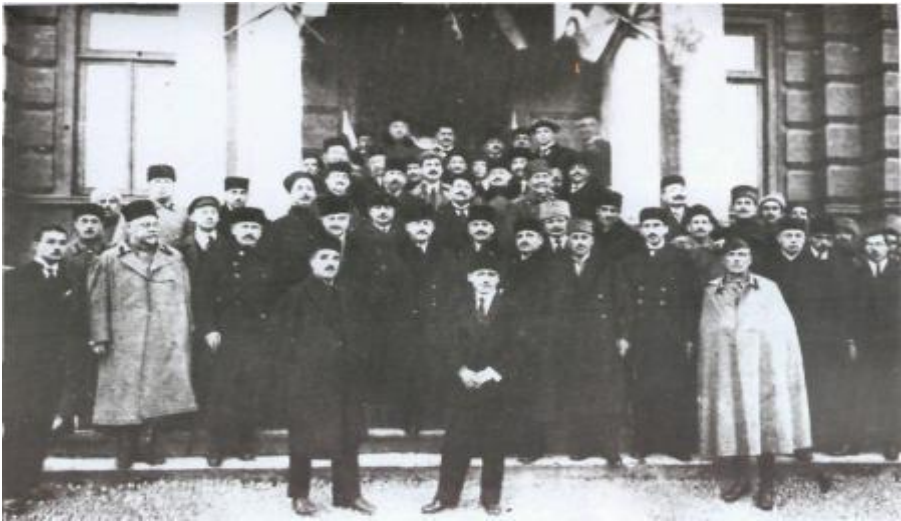
Azərbaycanın müstəqilliyinin Paris Sülh konfransı tərəfindən tanınması münasibətilə xarici işlər nazirliyində keçirilən qəbul. 14 yanvar, 1920-ci il.