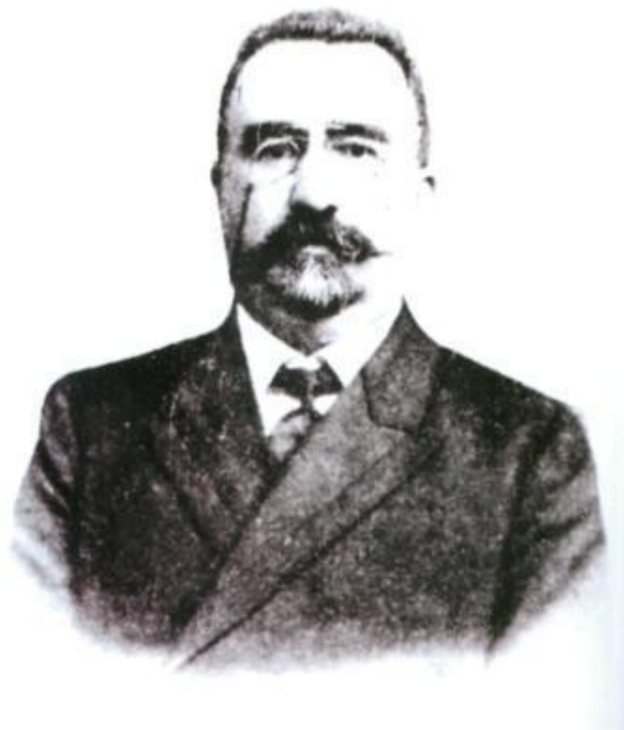
Azərbaycan Xalq Cümhuriyyəti Parlamentinin sədri Əli Mərdan bəy Topçubaşov