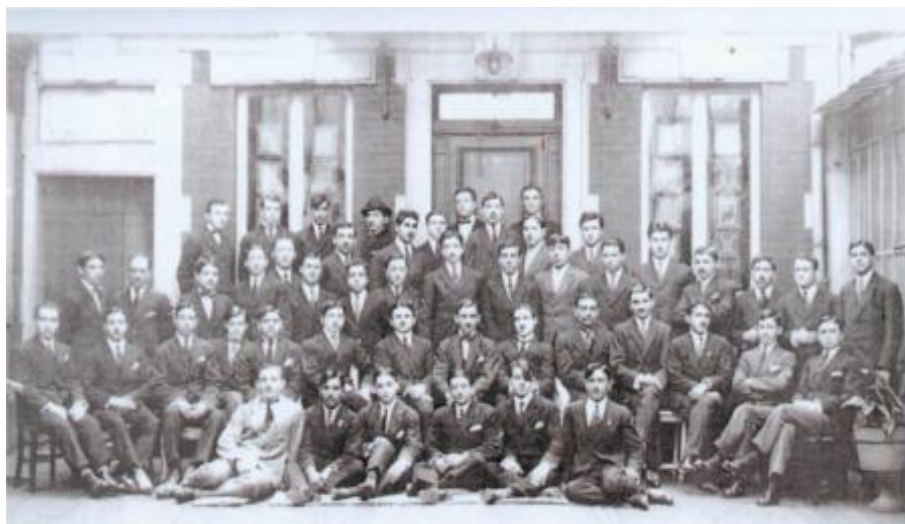
Azərbaycan Xalq Cümhuriyyətinin təhsil almaq üçün Avropa ölkələrinə göndərdiyi tələbələrin bir qrupu. 1919-cu il.