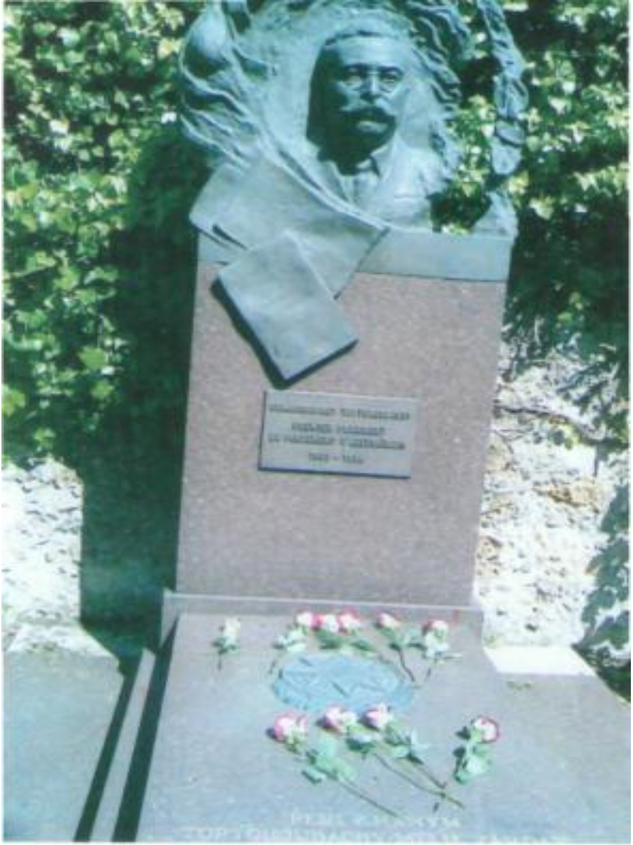
Ə.M. Topçubaşovun Paris yaxınlığındakı Saint Kloud şəhərindəki məzarlıqdakı qəbirüstü abidəsi.