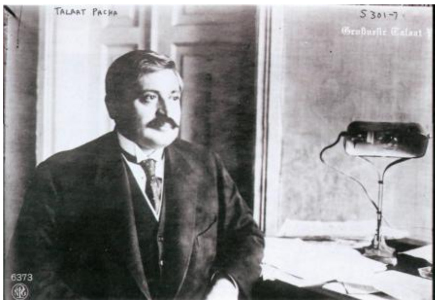
Türkiyə nazirlər kabinetinin sədri Tələt paşa