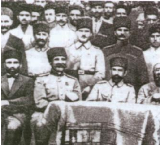
General Ə.Şıxlinski və Nuru paşa Gəncədə. İyun, 1918-ci il.