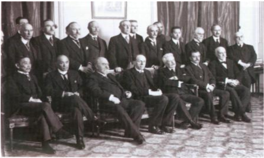
Müttəfiq dövlətlərin başçıları Paris sülh konfransında. Yanvar, 1919-cu il.