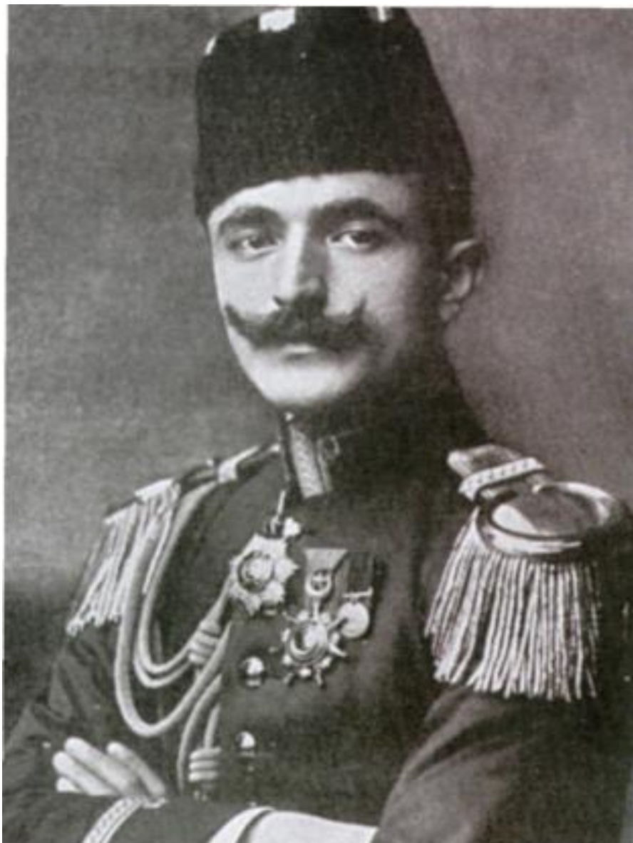
Osmanlı İmperatorluğunun hərbi naziri Ənvər paşa