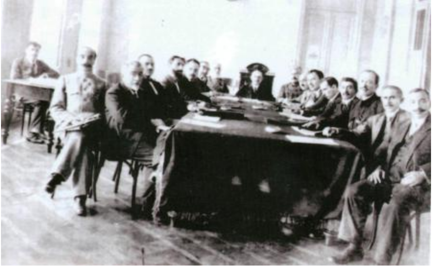
Azərbaycan Xalq Cümhuriyyəti IV hökumət kabinetinin iclası. Aprel, 1919-cu il.