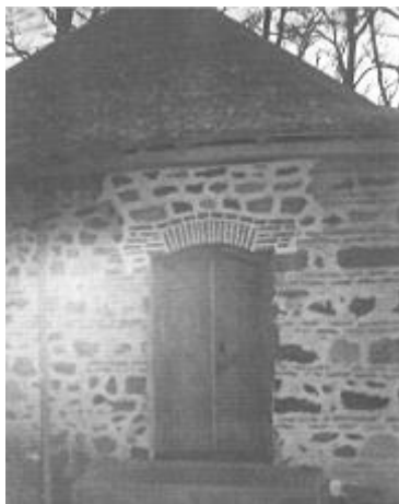
Şeyx Əhməd Əfəndinin günbəzi. Şəki rayonu, Baş- Şabalıd kəndi

K əramətləri ilə məşhur olan övliya Şeyx Əhməd Əfəndinin bir çox maraqlı əhvalatları bu gün də dillər əzbəridir. Deyilənə görə Baş Şabalıd kəndində Qara adlı bir dəllək varmış və övliya həmişə üz-başını ona qırxdırmış. Bir gün şeyx yenə də dəlləyi çağırtdıranda, Qara cavab verir ki, « İşim var, gələ bilmərəm ». Cavab Əhməd Əfəndinin xətrinə dəyir və deyir « Səni görüm işdən dincəlməyəsən ». Deyilənə görə o vaxtdan dəllək Qaranın səhərdən axşamacan dincəldiyini görənlər olmayıb. Bu gün bölgədə işlənən « Filankəs dallək Qara kimi dayanıb-dincəlmir » deyimi də, bu əhvalatla bağlıdır.