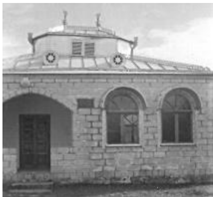
Katex kəndinin məscidi