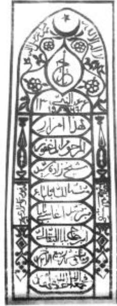
Mütübillah Babanın qəbri. Şəki rayonu, Bakkal kəndi

Övliya dünyadan köçməzdən bir gün qabaq, qızı Məkkə xanıma bir neçə vəsiyyəət etdi.