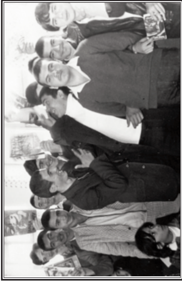
Son zəng. Sınıf sinifə, ovqat ovqata qarışıb