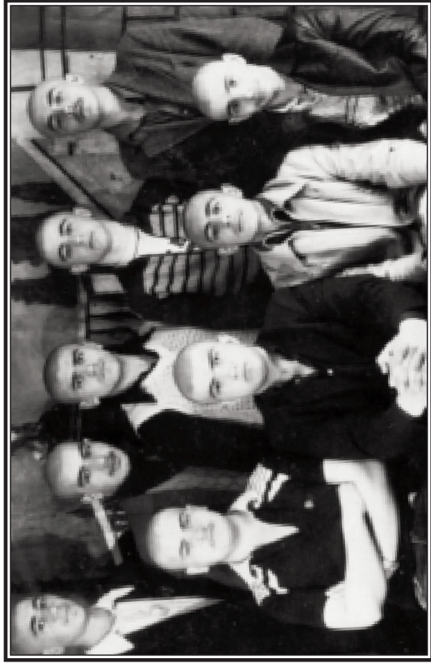
Məktəb direktoru uzun saç saxlamağa sət qadağa qoymuşdu. Bizim sinif buna kütləvi keçəlləşməylə etiraz elədi. Mən utandım başımı dibdən qırxdırmağa