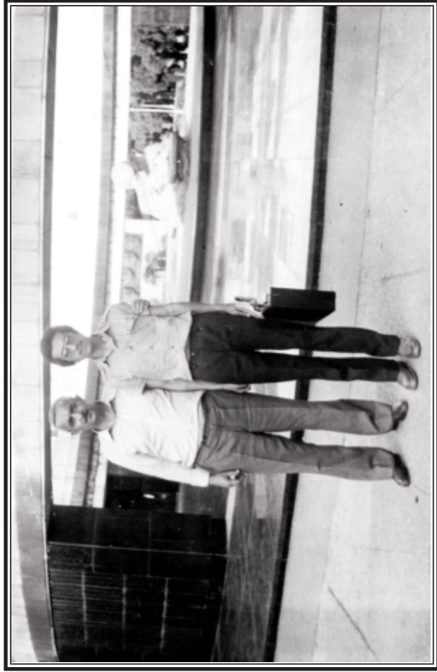
Bakının zəhmi basıb məni. Məktəbi qurtaran ildi - 1983. Atasızlığa, yurdsuzluğa çox var hələ