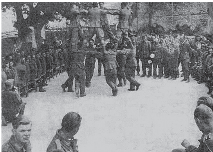
Armenian legionnaires of Wehrmacht, after the “successful” destroying mission לגינורים ארמנים של הורמאכט, לאחר «הצלחת» משימת ההשמדה