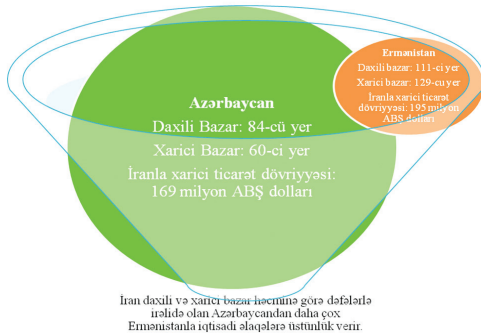
Diagram. 1. İranın Azərbaycan və Ermənistanla iqtisadi əlaqələrində disproportsiya