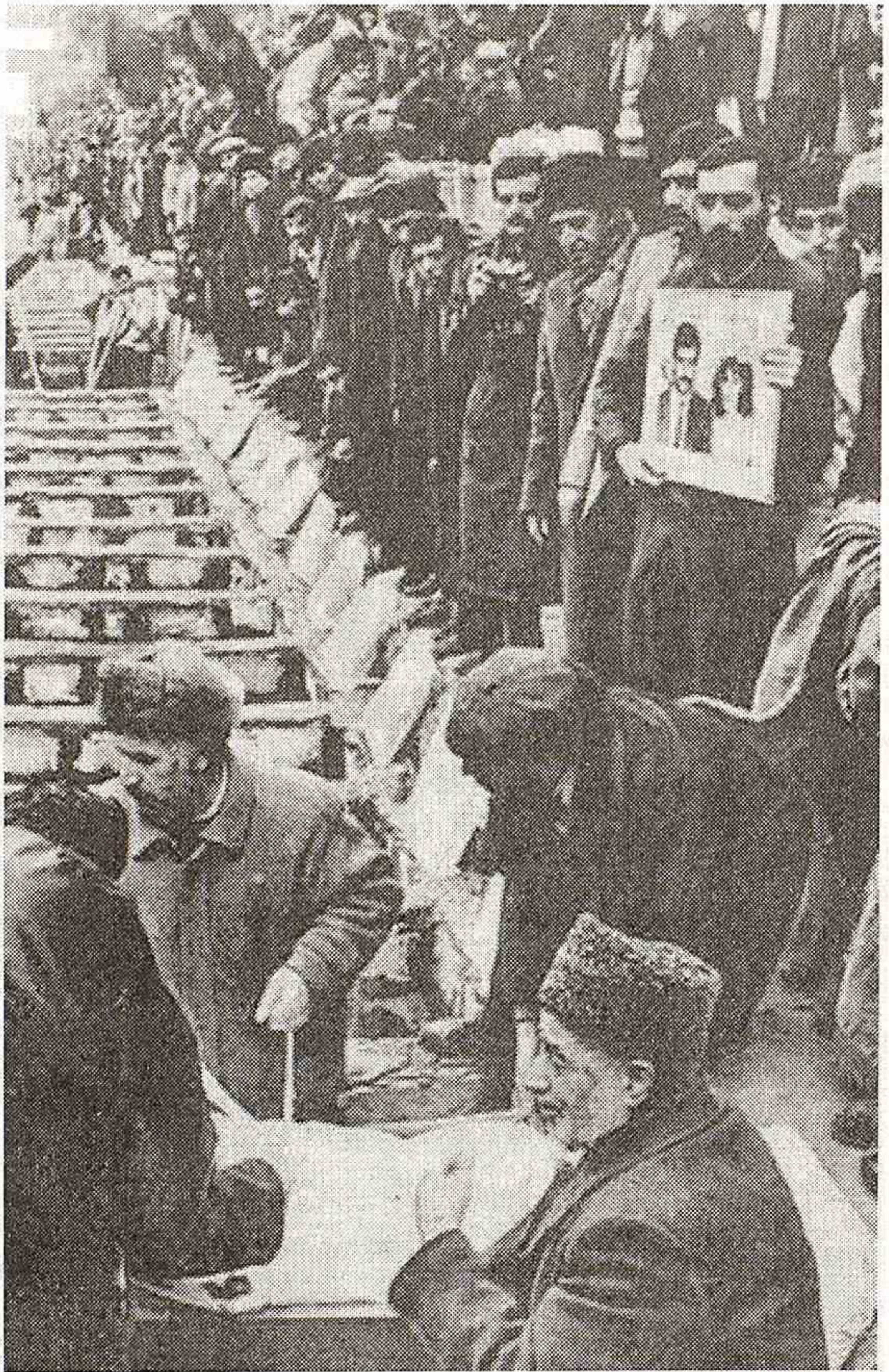
Sıra ilə qazılmış qəbirlər «sahiblərini» gözləyir...