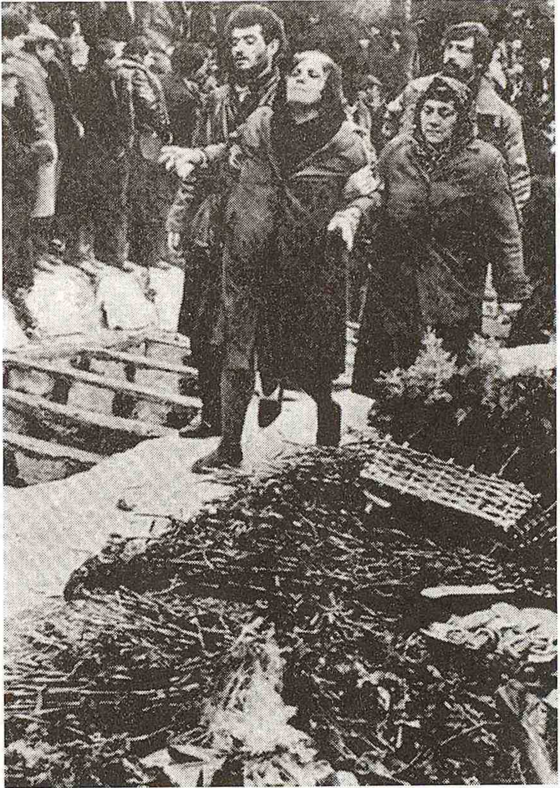
Şəhidlər torpağa tapşırılır... Analar isə müsibətin ağırlığına tab gətirə bilmirlər...