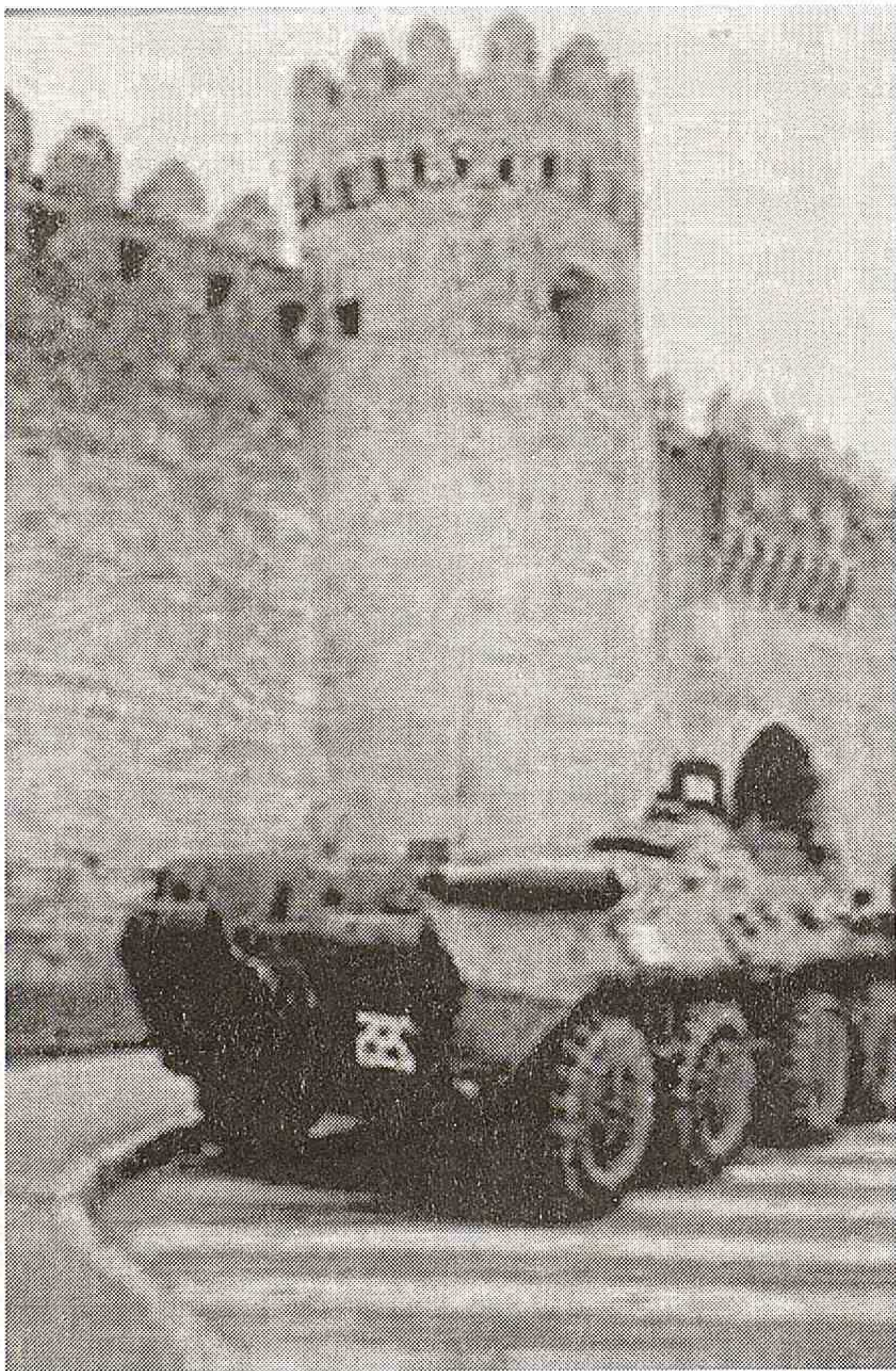
Pusquda dayanıb, «şığımağa» hazırlaşan «Qızıl ordu»nun hər b maşını...