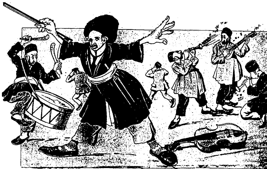
(17) «لویداجی» یادداق چیتیش لوب و لب آئی اولیش موسیقیزی دیرلیبر . (17)

Sentyabrın 18-də milli müqəddəslərimizdən hesab olunan da-hi sənətkar, qeyrətli millət mücahidi Üzeyir bəyin anadan olmasının 116-cı ildönümünü çox böyük minnətdarlıq və şükran hissi ilə qeyd edəcək, həm də onun zəngin və keşməkeşli həyat yolunu öyrənmək sahəsindəki səylərimizi davam etdirəcəyik.