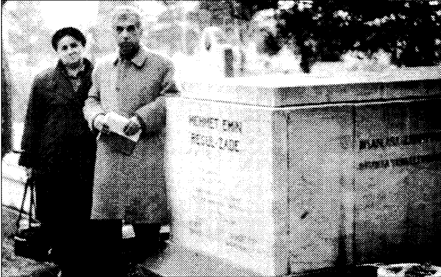
M.Ə.Rəsulzadənin məzarı önündə. Ankara. "Əsri" qəbristanlığı. 1988-ci il

1920 -ci il aprelin 27-si günü, milli müstəqilliyimizə qarşı daxildən və xaricdən uzun müddət hazırlanıb həyata keçirilən silahlı çevriliş və onun 70 illik fəsadları haqqında hələ də lazımınca indiki nəsle tutarlı, inandırıcı, sistemli bir əsər təqdim olunmamışdır. Bu illərdə hakimiyyətdə olan siyasi partiya və şəxslərə, onların əhatəsinə